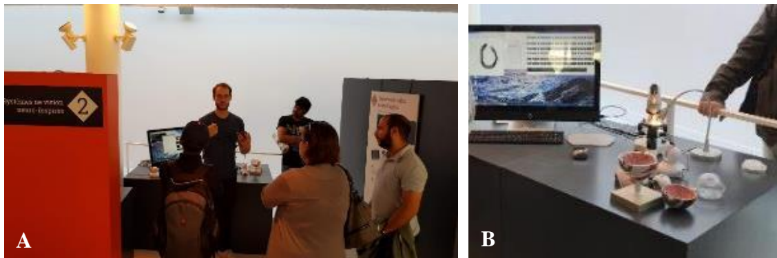
Fig.1. Le stand à l'Xpérium A : Animation du stand « Système de vision neuroinspirée : application à la vision artificielle » présentée pendant la troisième saison de l'Xpérium – 2018 - 2020. B : éléments et démonstrateurs à disposition de l'animateur.

Les stands présentés à l'Xpérium sont animés de façon interactive par les doctorants. Chaque thématique de recherche fait l'objet d'une présentation orale et de démonstrations, pour une durée moyenne de 10 à 15 minutes par stand (Fig.1).