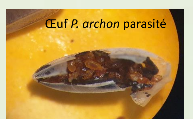
Œuf P. archon parasité