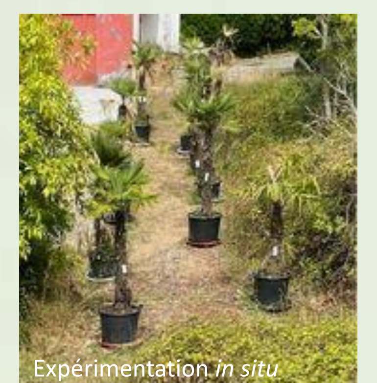
Expérimentation in situ