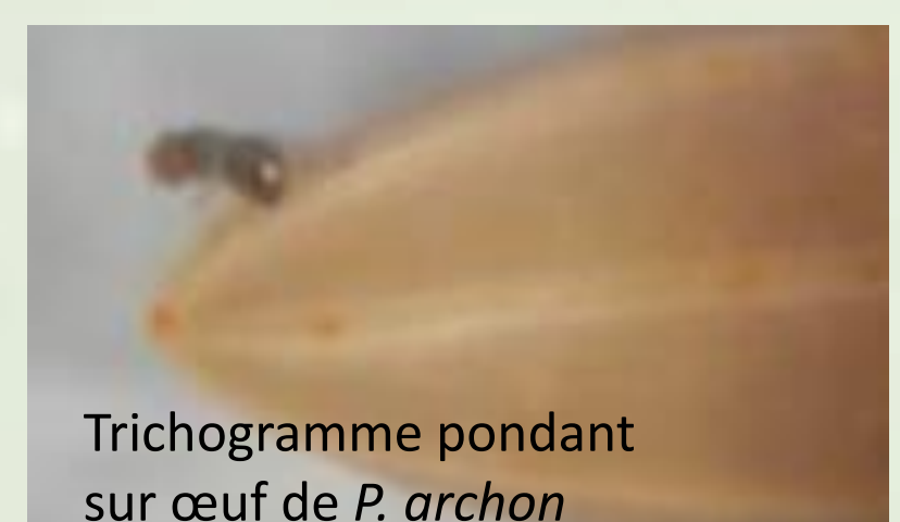
Trichogramme pondant sur œuf de P. archon

→ La stratégie de lâcher a été établie pour le parasitoïde oophage retenu. Elle est fiable et adaptée pour les espaces verts, les professionnels ainsi que pour les particuliers dans le respect de l'environnement. Cette stratégie permet de diminuer le nombre de larves dans les palmiers, et se combine avec les autres méthodes visant le stade larvaire.