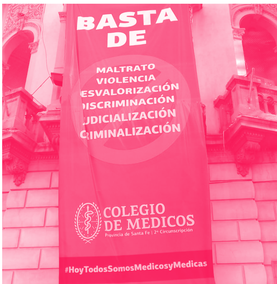
Figure 1. Bannière de l'ordre des médecins de la province de Santa Fe, Argentine