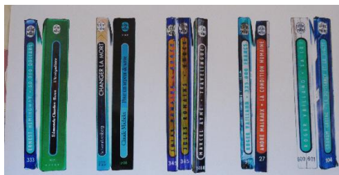
FIG. 3 – « Chance Encounters on shelves » Sanfourche, Toulouse, 2014

On peut noter ici le contenu didactique du cartel, qui inscrit cette œuvre comme éclairage de l'exposition du livre d'artistes, dans une sorte d'inversion puisque c'est le livre qui est ici documenté par l'œuvre. Elle met ainsi en lumière le hasard esthétique qui peut se créer entre des livres et un classement, matérialisé ici par des couleurs, la série, la collection et la serendipité.