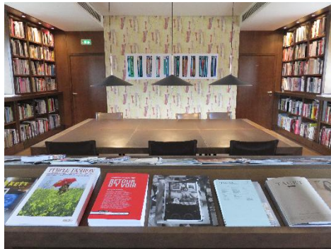
FIG. 2 – présentoir de revues avec en arrière-plan une œuvre d'art

L'exposition de livres d'artistes dans la médiathèque intègre également quatre œuvres d'art exposées sur les murs qui chacune questionnent un aspect documentaire :