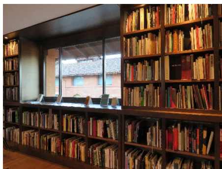
FIG. 5 – Étagères et niches présentant les ouvrages documentaires

Autour de l'espace d'exposition matérialisé par les vitrines, des étagères sont disposées tout autour de l'espace, meubles fixes en bois sombre qui semble être du bois exotique et qui offre une atmosphère à la fois chaleureuse et luxueuse des lieux. Les encadrements de fenêtres offrent des sortes de « niches » aménagées entre les rayonnages, qui permettent de présenter des ouvrages.