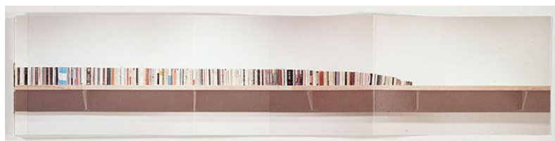
FIG. 4 – Buzz Spector. Unpacking my library, 1995

Une deuxième œuvre est également exposée sur un mur. L'artiste a réuni tous les livres de sa bibliothèque (plus de 4000 titres) et les a présentés alignés sur une étagère, selon un classement par tailles. L'œuvre qui en résulte est une photographie panoramique de cette installation.