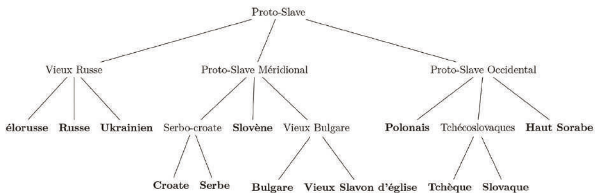
Figure 2 - Exemple d'arbre phylogénétique. Rameau slave de l'arbre phylogénétique utilisé pour nos travaux. Les noms des nœuds intermédiaires sont indicatifs, seules la structure de l'arbre et la place des feuilles (en gras) sont importantes. Le pluriel tchécoslovaque réfère aux langues du groupe tchécoslovaque et non pas à la norme écrite utilisée dans les années 1920 et 1930.

qu'ils évoluent d'une manière similaire à ces langues. Par exemple, si l'on avait des corpus pour les langues romanes représentant leur état tous les cinquante ans en commençant en l'an zéro et jusqu'aujourd'hui, l'on pourrait s'attendre à ce que des modèles d'analyse, appris sur chacun de ces corpus, forment une structure similaire à celle proposée par les linguistes historiques pour les langues romanes elles-mêmes. L'on s'attendrait entre autres à ce que des modèles représentant des corpus proches en terme de dates et de variétés (picard de 1150 et normand de 1300), soient plus proches que des modèles représentant des variétés très différentes (portugais de 1900 et roumain de 1300).