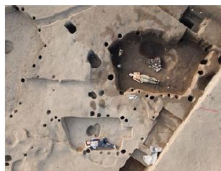
Photographie satellite du site de Dajinshan