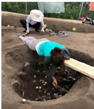
Fouille d'une fosse remplie de coquillages

L'ensemble de huit fonds de cabane découvert sur la zone de fouille de la MAFNEC constitue un ensemble unique de structures architecturales du 1er millénaire fouillé dans la province du Jilin. Ces fonds de cabanes présentaient des niveaux d'occupations saturés d'os de poissons. Différentes fosses remplies de coquillages ont été fouillées.