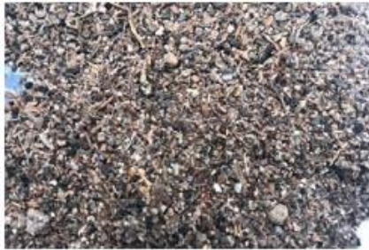
Faune et charbons issus du tamisage du fond de cabane n. 8