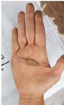
Une pointe de flèche en os

Les travaux de la MAFNEC sur le site de Dajinshan en 2018 indiquent la présence d' une communauté au milieu et dans la deuxième moitié du 1er millénaire av. n. è., dont les activités étaient basées sur la chasse (Fig. 9) et la pêche. Ils cuisaient leur nourriture dans des jarres à fonds plat posées directement dans le foyer (traces d' usure sur les poteries), cousaient des filets (aiguilles, poids de filets), taillaient et polissaient des outils en pierre, et confectionnaient des habits en fourrures. Cette communauté s' était installée sur ce qui était alors une rive de la rivière Dongliao.