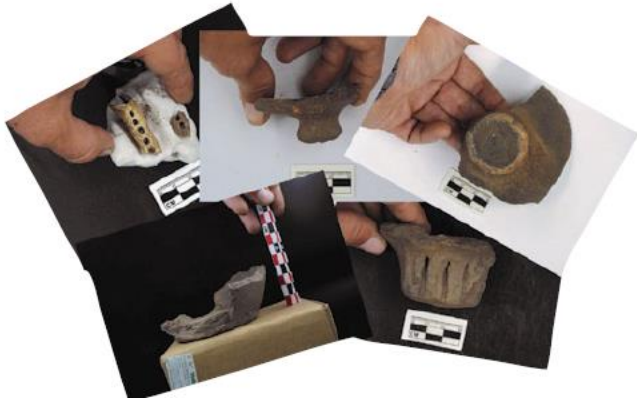
Quelques objets découverts sur le site de Dajinshan en 2018

L'ensemble de huit fonds de cabane découvert sur la zone de fouille de la MAFNEC constitue un ensemble unique de structures architecturales du 1er millénaire fouillé dans la province du Jilin. Ces fonds de cabanes présentaient des niveaux d'occupations saturés d'os de poissons. Différentes fosses remplies de coquillages ont été fouillées.