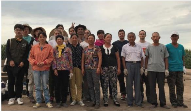
Photo de l'équipe franco-chinoise sur le site de Dajinshan