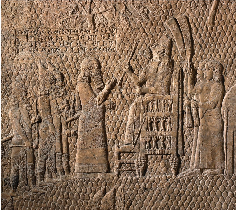
Figura 5 – Recorte e detalhe de placa de pedra esculpida em baixo relevo, do palácio sudoeste de Nínive (Séc. VIII-VII AEC). Na parte centro-superior da imagem, há uma pequena caixa contendo uma inscrição em cuneiforme. Fonte: ©The Trustees of the British Museum (BM 124911).

Considerando a complementaridade entre fontes escritas e de cultura material, tal componente serve para se analisar diferentes aspectos evocados por essas fontes. A configuração arquitetônica – e, portanto, material – da espacialidade palaciana também despertou análises sobre seu programa intencional, a ponto de conduzir a movimentação corporal, visual e cognitiva, bem como despertar um ambiente com estímulos sensoriais intencionados. 114 Sendo assim, a disposição dos relevos nas paredes dos palácios, que implica uma programação, corresponde ao que está nos relevos (textos e imagens) e à posição do observador para que sejam vistos. Além disso, tal disposição inclui a interação com as próprias pessoas representadas (e, aqui, destaca-se, por exemplo, a figura do rei, especialmente nas salas dos tronos dos palácios), bem como os elementos individuais e os motivos gerais têm em muitas situações posições específicas nas salas. 115