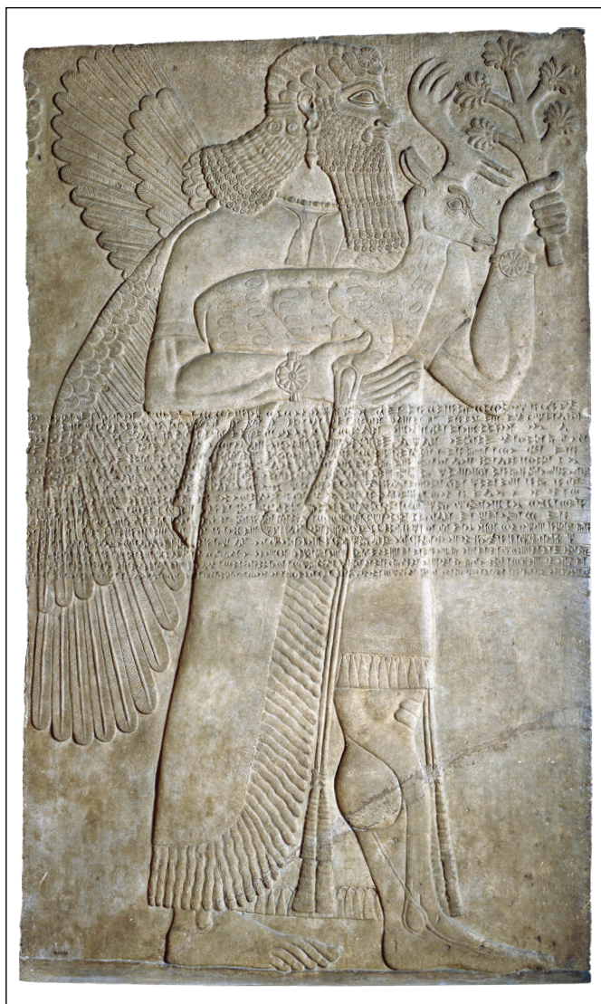
Figura 4 – Placa com escultura em baixo relevo, palácio Noroeste de Nimrud (séc. IX AEC). Na placa, a inscrição em cuneiforme foi feita em sua parte medial, perpassando a figura esculpida. Fonte: ©The Trustees of the British Museum (BM 124560).

ponto de vista metodológico, a natureza dessas fontes estimulou a análise conjunta de fontes materiais e escritas, 111 a ponto de uma complementaridade servir como categoria de análise. “Desse modo, textos e relevos fazem parte de um ambiente de produção material e textual [centralizada na figura do soberano] onde ambas as naturezas expressivas (materialidade e textualidade) podem confluir-se”. 112 Segundo Muth et al., a presença de imagens e textos num mesmo suporte não é, para a realidade da antiguidade, estabelecida numa hierarquia de elementos expressivos e comunicativos, mas sim configura uma realização concomitante, envolvendo a interação de elementos textuais e iconográficos. 113