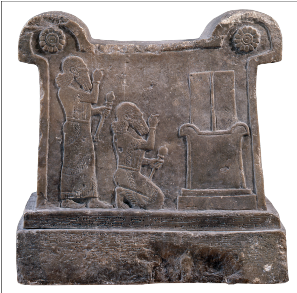
Figura 3 – Pedestal de Nusku, séc. XIII-XII AEC. Fonte: © Staatlichen Museen zu Berlin-Vorderasiatisches Museum (VA 08146). Foto: Olaf M. Teßmer.