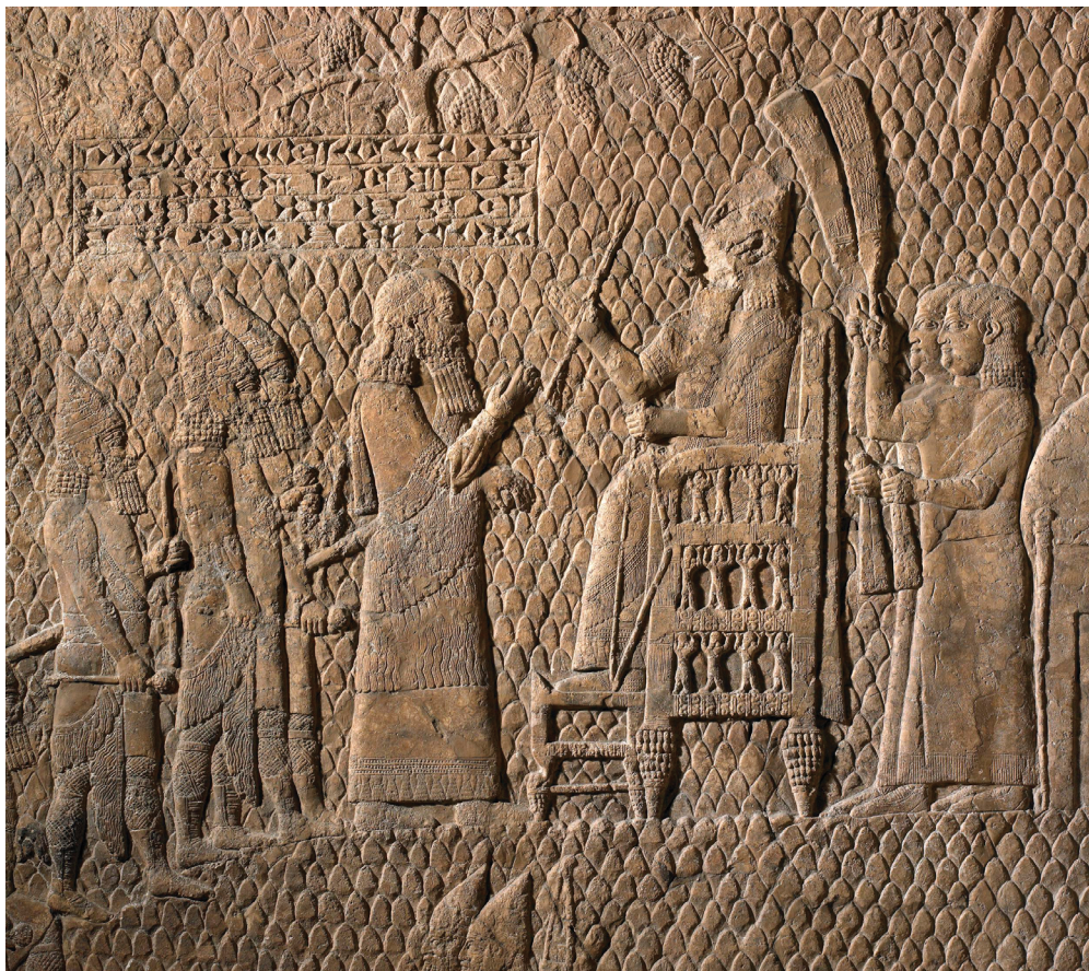
Figura 5 – Recorte e detalhe de placa de pedra esculpida em baixo relevo, do palácio sudoeste de Nínive (Séc. VIII-VII AEC). Na parte centro-superior da imagem, há uma pequena caixa contendo uma inscrição em cuneiforme. Fonte: ©The Trustees of the British Museum (BM 124911).

Considerando a complementaridade entre fontes escritas e de cultura material, tal componente serve para se analisar diferentes aspectos evocados por essas fontes. A configuração arquitetônica – e, portanto, material – da espacialidade palaciana também despertou análises sobre seu programa intencional, a ponto de conduzir a movimentação corporal, visual e cognitiva, bem como despertar um ambiente com estímulos sensoriais intencionados. 114 Sendo assim, a disposição dos relevos nas paredes dos palácios, que implica uma programação, corresponde ao que está nos relevos (textos e imagens) e à posição do observador para que sejam vistos. Além disso, tal disposição inclui a interação com as próprias pessoas representadas (e, aqui, destaca-se, por exemplo, a figura do rei, especialmente nas salas dos tronos dos palácios), bem como os elementos individuais e os motivos gerais têm em muitas situações posições específicas nas salas. 115