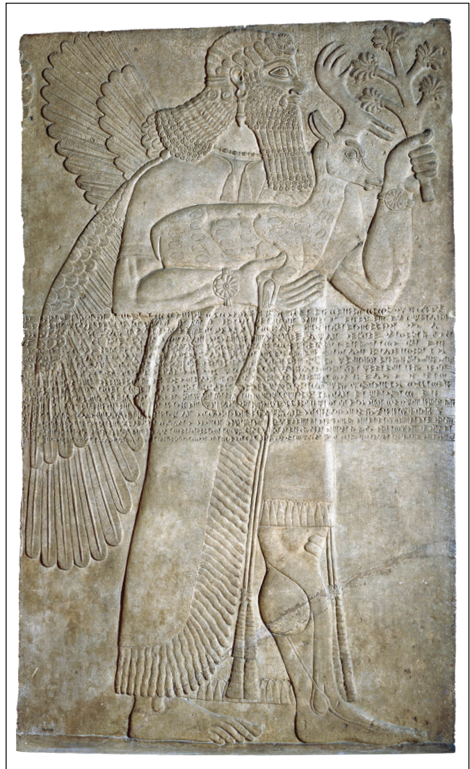
Figura 4 – Placa com escultura em baixo relevo, palácio Noroeste de Nimrud (séc. IX AEC). Na placa, a inscrição em cuneiforme foi feita em sua parte medial, perpassando a figura esculpida. Fonte: ©The Trustees of the British Museum (BM 124560).

ponto de vista metodológico, a natureza dessas fontes estimulou a análise conjunta de fontes materiais e escritas, 111 a ponto de uma complementaridade servir como categoria de análise. “Desse modo, textos e relevos fazem parte de um ambiente de produção material e textual [centralizada na figura do soberano] onde ambas as naturezas expressivas (materialidade e textualidade) podem confluir-se”. 112 Segundo Muth et al., a presença de imagens e textos num mesmo suporte não é, para a realidade da antiguidade, estabelecida numa hierarquia de elementos expressivos e comunicativos, mas sim configura uma realização concomitante, envolvendo a interação de elementos textuais e iconográficos. 113