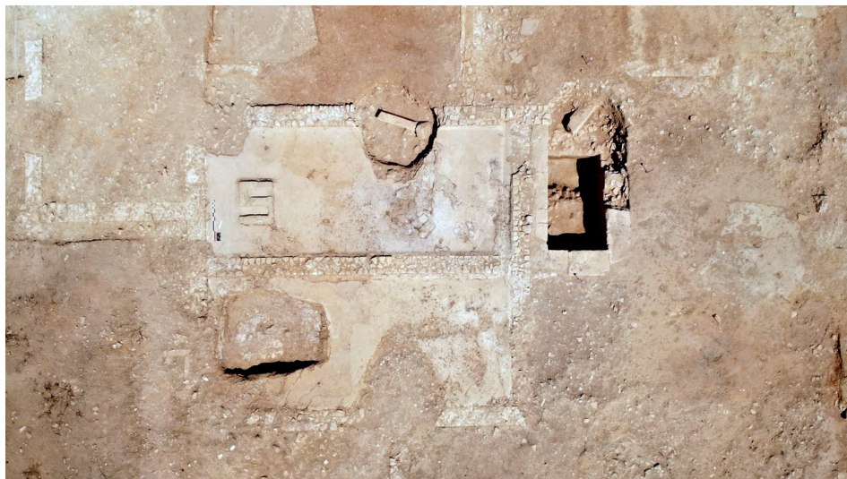
Figure 2 : Les bassins pressoirs installés au II e siècle de notre ère dans l'angle nord-est de la villa.

La découverte de pressoirs pose la question de l'identification du produit : ils pouvaient être utilisés aussi bien pour le vin que pour l'huile 66 . P. Leveau signalait que pour discriminer le vin de l'huile, il fallait considérer le moulin dont l'usage est réservé à l'oléiculture et le fouloir qui l'est à la viticulture (Leveau 2003, p. 300). Pour J.-P. Brun, la présence du fouloir n'est pas obligatoire, le bassin pressoir lui-même pouvant faire office 67 .