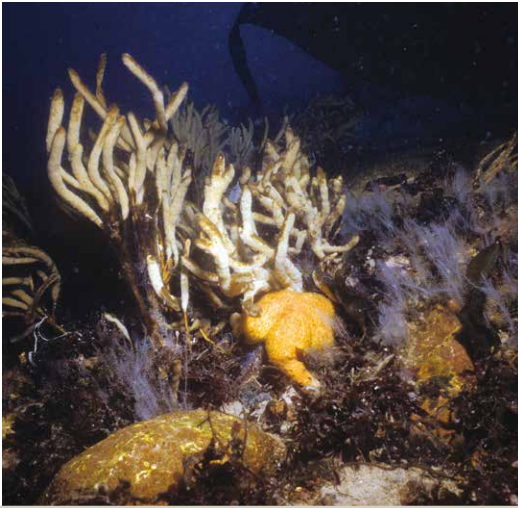
L'éponge digitiforme Homaxinella balfourensis est fréquente sur les roches (ici accompagnée de l'hydraire Oswaldella terranovaeva ). Elle est la proie de plusieurs astéries comme Perknaster fuscus antarctica .

explorées, on note la présence fréquente de spongiaires blanchâtres ( Hemigellius fimbriatus ou Haliclona sp.) agrégés avec des hydrides ( Oswaldella terranovaeva ), des anthozoaires ( Alcyonium antarctica , Urticinopsis antarctica ), des annélides ( Potamilla antarctica ), des némerthes, des astéries ( Perknaster fuscus antarcticus ), et des holothuries ( Heterocucumis steinerni ), formant des mini-oasis à l'abri d'une roche. Ces premières plongées étaient l'étape nécessaire pour démontrer la possibilité d'étudier le domaine marin à la base Dumont-d'Urville. Technique la moins invasive et la plus efficace pour l'observation et l'expérimentation dans les milieux côtiers, la plongée se révéla indispensable à l'étude de la biodiversité , concept et expression dont l'intérêt ira croissant après le sommet de la Terre, à Rio de Janeiro, en 1992. Les décennies qui ont suivi ont vu se développer à Dumont-d'Urville des programmes qui ont permis de confirmer l'extraordinaire biodiversité des eaux côtières antarctiques, mais dont le rôle dans le fonctionnement des écosystèmes reste à évaluer. En plus de leur intérêt écologique, ces espèces représentent une source non exploitée de substances actives d'intérêt thérapeutique ou industriel. Le benthos antarctique offre aussi la possibilité de découvrir des processus physiologiques inédits. Il en a été ainsi pour les poissons des glaces (Channichthyidae, Nototheniidae):