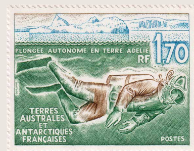
En 1989, la sortie du timbre TAAF n° 146 - N** ZT80A commémorait les premières plongées scientifiques en terre Adélie.

la manipulation des organismes à récolter tout comme celle des commandes des appareils photos ou des réglages du vêtement. Même des gants étanches ou les plus épais des gants de néoprène n'offraient qu'une protection très brève. La sensation de froid se transformait en douleur, puis on ne sentait plus rien. Cela empêchait de doser la pression exercée, par exemple, sur un oursin qui échappait à l'emprise ou bien était écrabouillé selon que la pression pour le saisir était trop faible ou trop forte. À la remontée, des gants d'alpiniste, munis d'une poche à charbon actif chauffant, aidaient à rendre sensibilité et mobilité des doigts en quelques dizaines de minutes. Un autre inconvénient était la possibilité de "givrage" des détendeurs qui, se mettant en débit constant n'étaient plus contrôlables, rendant la respiration difficile et surtout provoquant un gaspillage d'air important entraînant une remontée aussi immédiate que contrôlée. Les débordoirs, tubes métalliques de plus d'un mètre de long destinés à éloigner les léopards de mer trop curieux, qu'on nous avait imposés "pour notre sécurité" se révélèrent aussi encombrants qu'inutiles : quand un phoque de Weddell ou, plus rarement, un léopard de mer nous suivait, il restait à distance derrière nous, nous observant, souvent en position verticale, mais n'approchant pas et s'enfuyant dès que l'on commençait à se retourner.