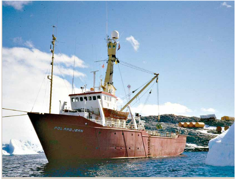
Polar Bjørn au mouillage dans l'anse du Pré, avec l'île des Pétrels en fond.

Enfin opérationnels, nous attendons le feu vert des autorités. Pas moyen d'avoir un zodiac! Nous décidons de faire notre plongée de réglage du matériel en partant du bord, près de la base du Lion, dans la baie du Large. L'équipe de la piste nous tient en laisse par des lignes de vie, trop courtes, que nous devons lâcher, provoquant un émoi passager. Conséquence de la formation annuelle de glace de fond, quasiment pas d'organismes dans les 6-8 premiers mètres. L'été s'installant et cette glace disparaissant, venus des alentours, quelques oursins ( Sterechinus neumayeri ) et astéries ( Odontaster validus ) vagabondent à ces profondeurs durant