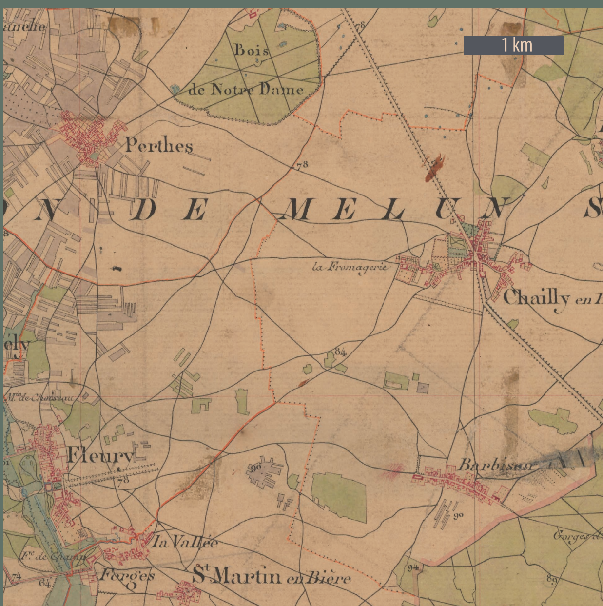
Extrait de la carte de l'état-major (1820-1866 ;)

La scène de L'Homme à la houe , représente un paysage de la plaine à l'ouest de Barbizon, village où réside alors Millet.