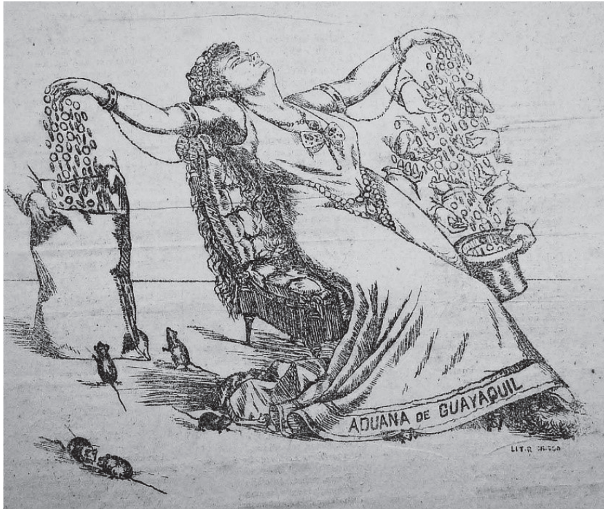
Figura 2. ¡Mater amabilis!

Fuente: Fray Gerundio (Guayaquil) 31 de octubre de 1885: 3.