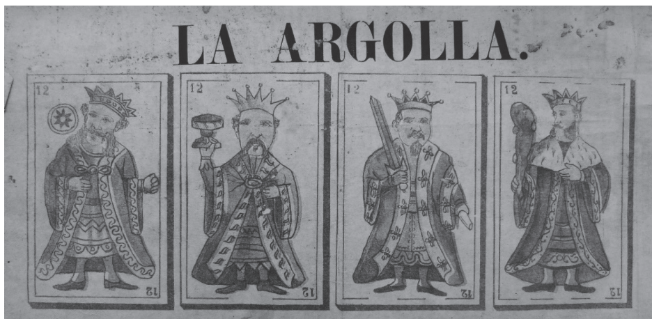
Figura 3. La Argolla. Figuras de la baraja ecuatoriana