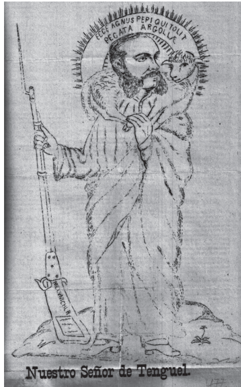
Figura 4. Nuestro señor de Tenguel