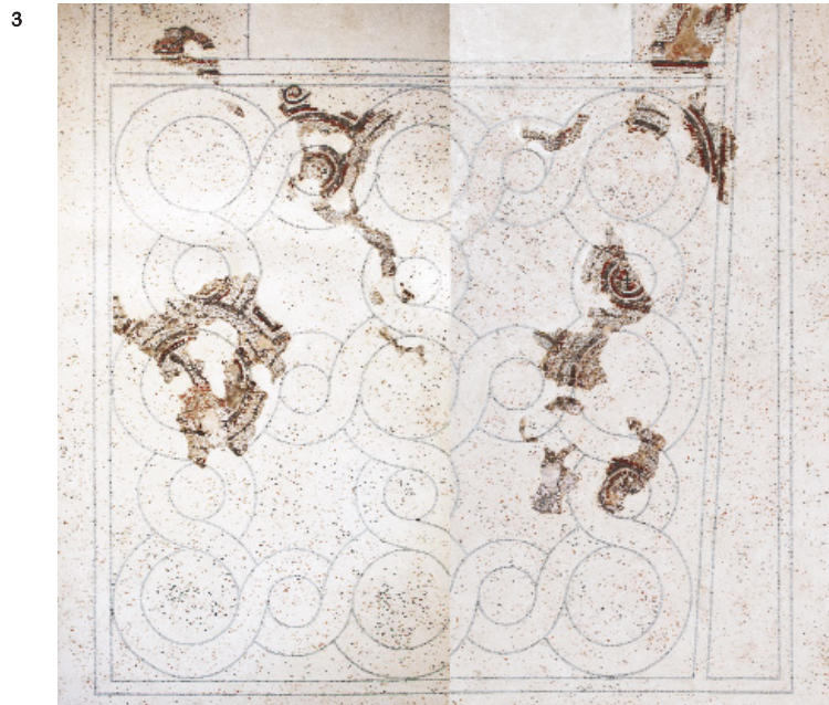
Fig. 6. — Mosaïque située au sud du podium (Photo P. Neri).

Fig. 5. — Mosaïque située au nord du podium (Photo P. Neri).