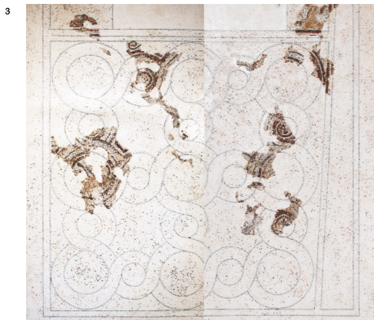
Fig. 6. — Mosaïque située au sud du podium (Photo P. Neri).

Fig. 5. — Mosaïque située au nord du podium (Photo P. Neri).