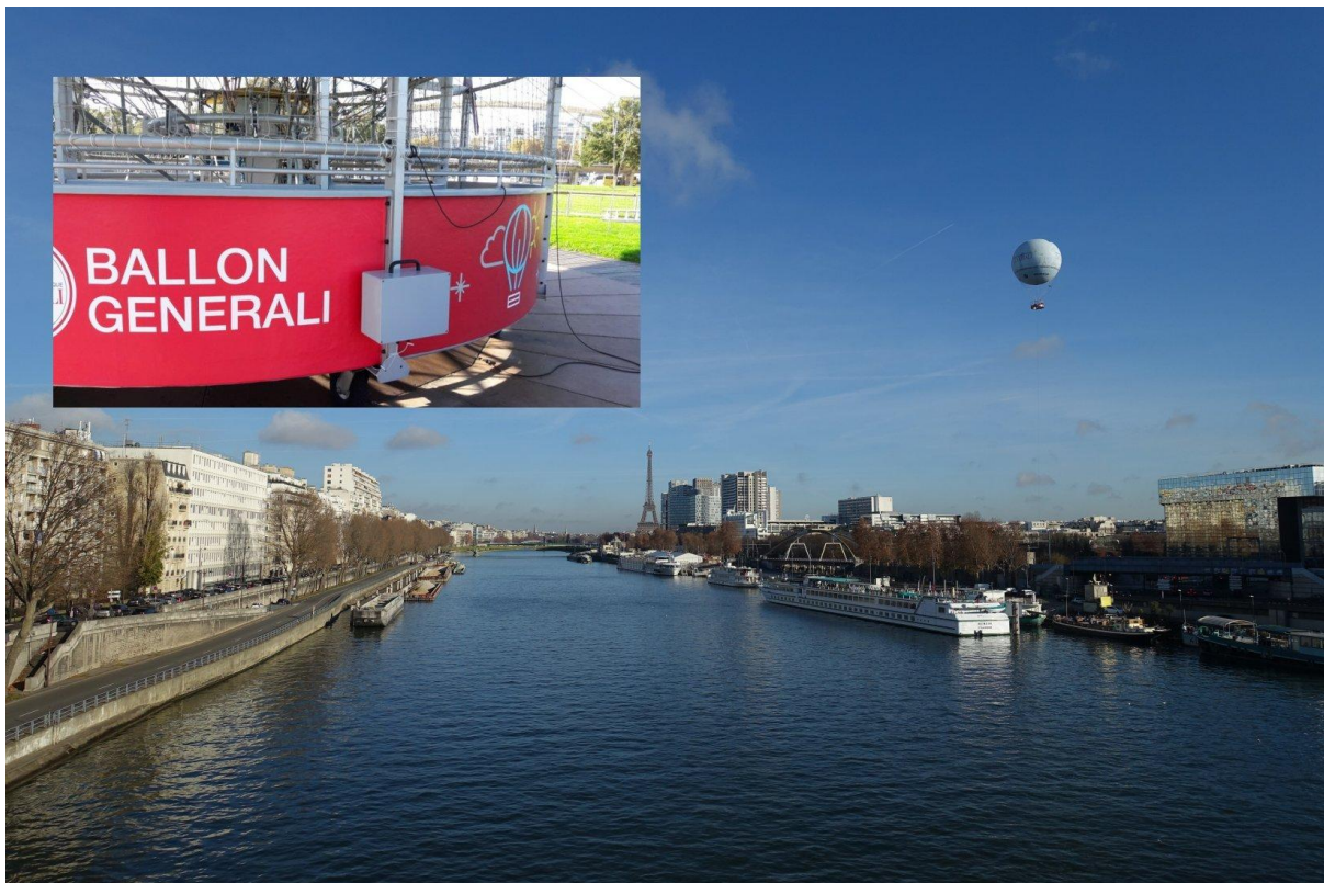
Figure 1 : Vue du ballon de Paris- Generali depuis le pont du Garigliano / Insert : installation du mini-analyseur d'ozone sur la nacelle du ballon

surveillance de la qualité de l'air a été installé sur la paroi extérieure de la nacelle (voir insert Figure 1) et réalise en permanence des mesures à une fréquence de 10 secondes. Avec plus de 450 jours de mesure parmi lesquels on compte plus d'une vingtaine de jours de pics de pollution à l'ozone (voir Figure 2), ces mesures, qui continueront encore en 2020, ont – à ce jour – conduit à plus de 7000 profils d'ozone entre 0 et 250 m d'altitude. Ceci constitue une base de données sans précédent (bientôt en Open Data ) qui pourra servir à l'amélioration et la validation des modèles de qualité de l'air.