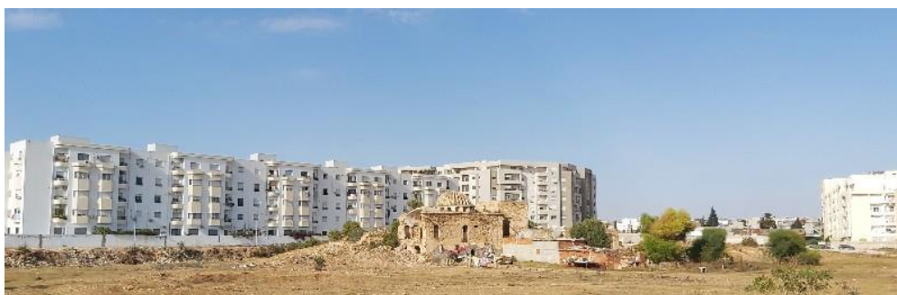
Figure 4. Le Burj Toukebri s'estompe et se perd dans son environnement (Anwar HAMROUNI, 2020)

Au milieu d'une forêt d'immeubles, à quelques pas d'un grand projet national urbain, se dresse Burj 10 Toukebri délabré, affaibli par le temps et l'oubli institutionnel, aussi bien que sociétal. De loin, sa grande coupole, ou ce qui en reste, se voit à peine au milieu d'un vaste terrain qui a servi jadis de terres agricoles dotés de « Nouria » 11 (Revault, 1974), qui est reléguée aujourd'hui à une « hofra » 12 perçue par les voisins comme un vivier de pratiques illicites.