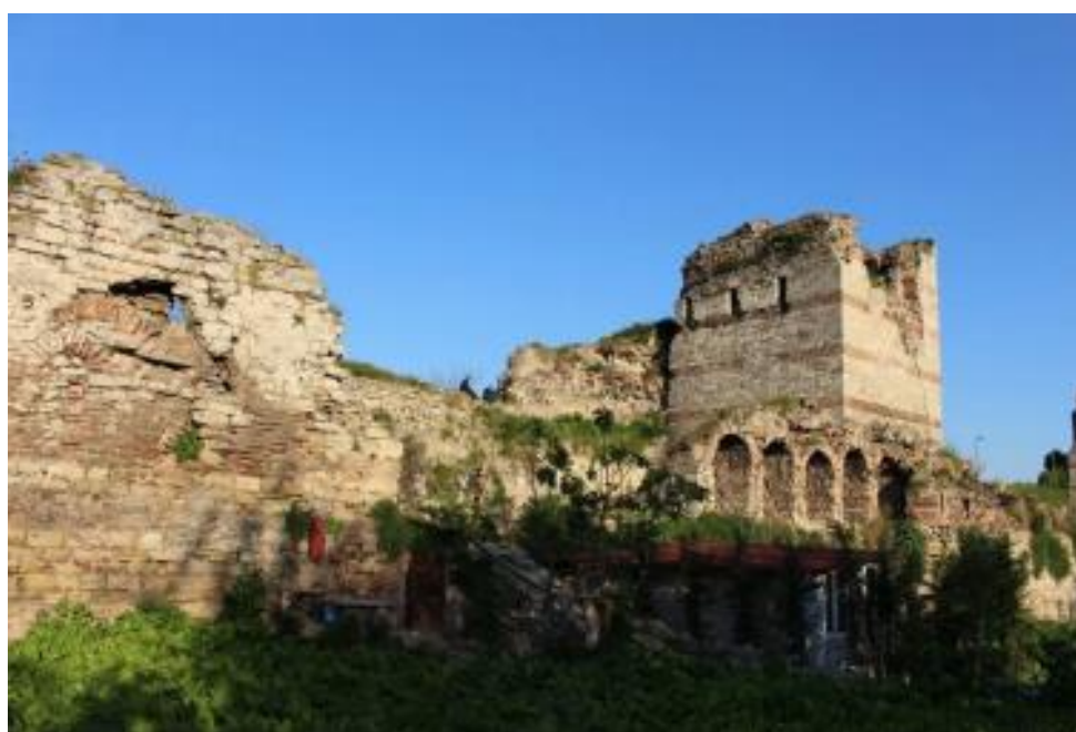
Figure 3. La marche implique de connaître les territoires d'autrui (Ümmühan Öztürk, 2018).

Marcher, c'est aussi saisir l'hospitalité, l'ouverture d'un lieu ; traverser où je suis acceptée par mon corps, éloigner si je rentre dans le territoire d'autrui (Figure 3).