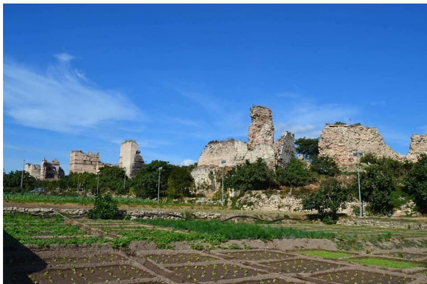
Figure 2. Vue sur les « bostan » millénaires de Yedikule et les murailles théodosiennes

Cette phrase mélangeant la mélancolie, la nostalgie d'un passé et la brutalité d'un présent a résonné dans ma tête quand pour la première fois, j'avais rencontré les remparts théodosiens le 7 juin 2016, près de l'arrêt de tramway de Topkapı. Petit à petit, mes pas ralentis en raison de la charge affective que j'éprouvais face aux murailles à l'état de quasi ruine, trouvent une allure plus rapide après avoir perçu de loin la verdure des « bostan » 7 .