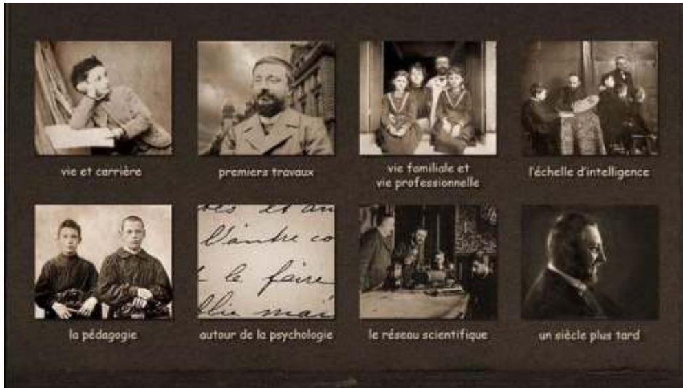
FIGURE 1. CAPTURE D'ÉCRAN DU MENU PRINCIPAL DU WEBDOCUMENTAIRE ALFRED BINET. NAISSANCE DE LA PSYCHOLOGIE SCIENTIFIQUE

Webdocumentaire réalisé par Philippe Thomine, co-écrit par Alexandre Klein et Philippe Thomine, sous la direction scientifique de Bernard Andrieu, université de Lorraine.