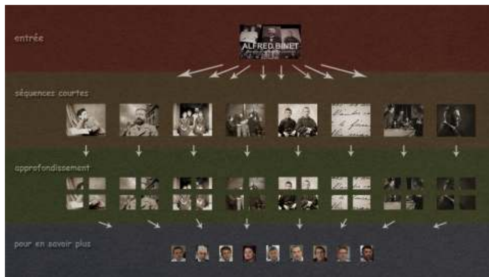
FIGURE 5. CAPTURE D'ÉCRAN DE L'ARBORESCENCE INTERACTIVE DU WEBDOCUMENTAIRE ALFRED BINET. NAISSANCE DE LA PSYCHOLOGIE SCIENTIFIQUE

Webdocumentaire réalisé par Philippe Thomine, co-écrit par Alexandre Klein et Philippe Thomine, sous la direction scientifique de Bernard Andrieu, université de Lorraine.