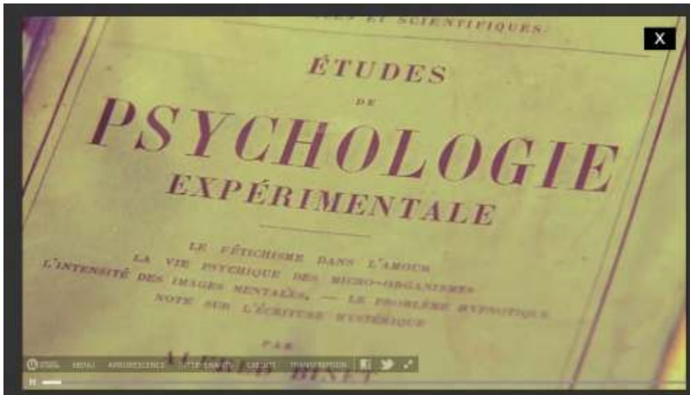
FIGURE 4. CAPTURE D'ÉCRAN D'UNE CAPSULE « EN SAVOIR PLUS » DANS LE WEBDOCUMENTAIRE ALFRED BINET. NAISSANCE DE LA PSYCHOLOGIE SCIENTIFIQUE

Webdocumentaire réalisé par Philippe Thomine, co-écrit par Alexandre Klein et Philippe Thomine, sous la direction scientifique de Bernard Andrieu, université de Lorraine.