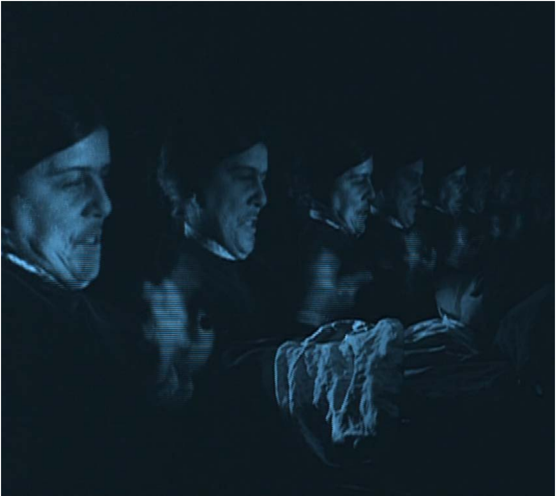
Poil de carotte (Julien Duvivier, 1926) © Collection Lobster Films.

D'autres effets esthétiques annihilent à l'écran les rapports de force traditionnels. Dans Poil de carotte (Julien Duvivier, 1926), la séquence du rêve de François offre un exemple de distorsion de la figure féminine. L'image de la mère du jeune garçon maltraité se dédouble à l'infini à l'écran. Cette démultiplication de la silhouette maternelle, située juste au-dessus du lit du fils, occupe pratiquement toute la surface du cadre et bouche la ligne d'horizon.