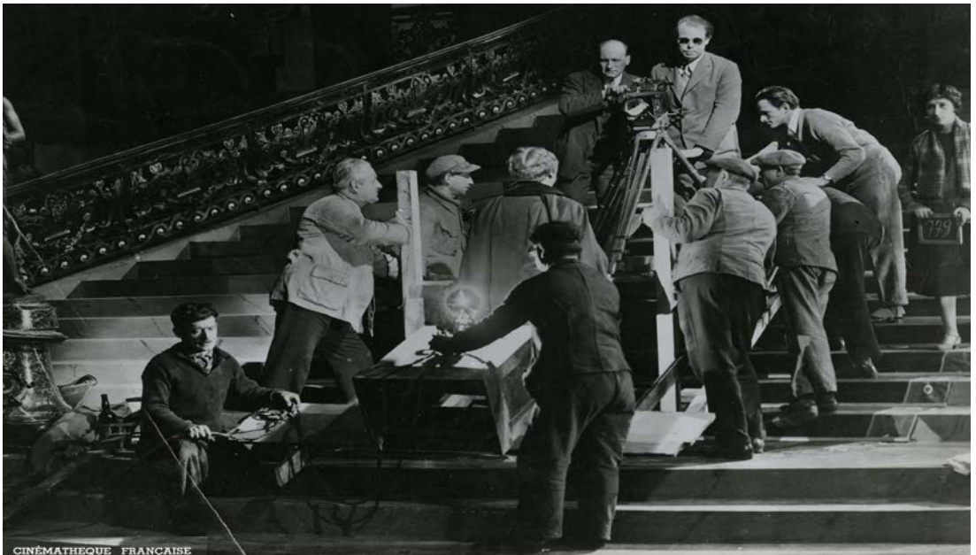
Tournage du film Nana (Jean Renoir, 1926)