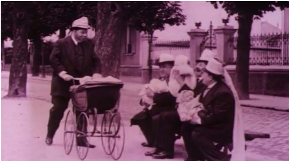
Les Femmes Députées – 1913

Cette présence du bâtiment municipal derrière les candidates évoque l'enjeu de l'actualité politique des années 1910. La mairie fait en effet partie à l'époque des assemblées locales pour lesquelles il est question d'ouvrir les urnes aux femmes. En 1910, deux ans avant l'année de réalisation de Femmes Députées , les débats à la chambre des députés s'animent autour de la proposition de loi de Paul Dussaussoy, décédé en mars 1909, qui « tend à conférer le droit de vote aux femmes pour les élections aux conseils municipaux, aux conseils d'arrondissement et aux conseils