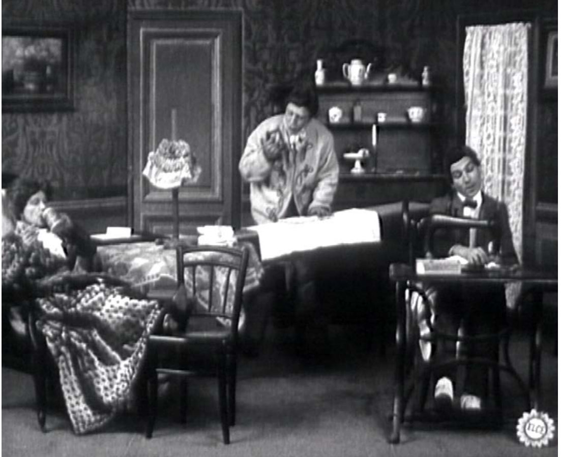
Les Résultats du féminisme , un film attribué à Alice Guy © Une production Gaumont, 1906.