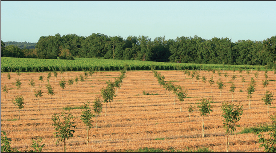
Photo 1 Un projet monospécifique qui aurait eu plus de cachet avec un peu plus de diversité dans les essences plantées... et moins risqué d'un point de vue phytosanitaire.

de la PAC ? Un projet agroforestier, comme tout projet agricole, doit pouvoir être conçu avec une vision à long terme. En agroforesterie, on ne cherche pas à maximiser les rendements de l'année prochaine mais à réduire les risques sur le long terme par une préservation des sols, de la biodiversité, de la qualité de l'eau. Mais, sur le long terme, comme l'ont montré les travaux de l'INRA de Montpellier de ces dix dernières années, la production en termes de biomasse est supérieure et la rentabilité suit (Dupraz et Liagre, 2008). Pour l'agriculteur, toute la question réside alors dans l'investissement de départ et l'attente des premiers revenus liés à la vente des produits ligneux. Pour cette raison, il nous semble important que les réglementations puissent s'adapter à l'agroforesterie pour soutenir l'investissement et non l'inverse.