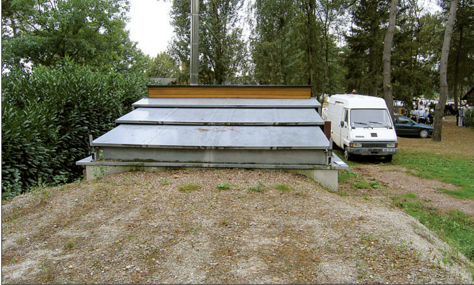
Photo 3 En Bretagne, de nombreux projets collectifs à l'échelle de la commune ont vu le jour comme ici à Iffendic. La collectivité a passé un contrat avec les agriculteurs pour rémunérer au plus juste le travail des agriculteurs, sachant que, au final, la communauté de communes sera gagnante par les économies d'énergie réalisées.

tante en animation de l'organisme porteur et par une concertation entre les acteurs du territoire. D'autre part, la notion d'échelle des projets est importante. Afin de sécuriser les marchés et les contrats entre les acteurs, ces projets doivent être conçus à taille humaine, communale. Concernant le bois-énergie, on sait maintenant que le gigantisme de certains projets fragilise l'ensemble