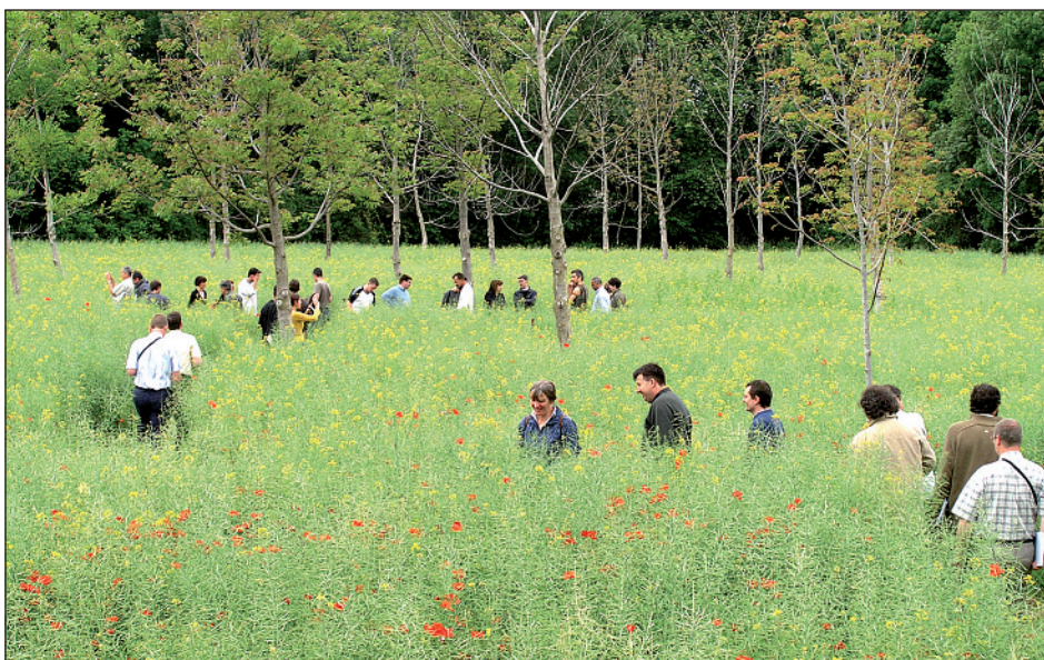
Photo 2 Pour faire reconnaître les résultats des parcelles agroforestières, de nombreuses visites ont été organisées sur le terrain. Pas moins d'une centaine de visites ont ainsi été réalisées lors des 10 dernières années par les membres fondateurs de l'Association française d'agroforesterie. Ici sur le site expérimental de Restinclières dans l'Hérault.

À la suite des démarches de la profession agricole et agroforestière, la situation évolue dans le bon sens. En 2009, l'agroforesterie est mieux reconnue dans les réglementations et il est à