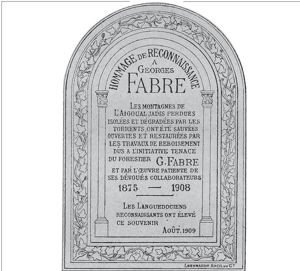
FIGURE 1 MONUMENT GEORGES FABRE SUR L'AIGOUAL