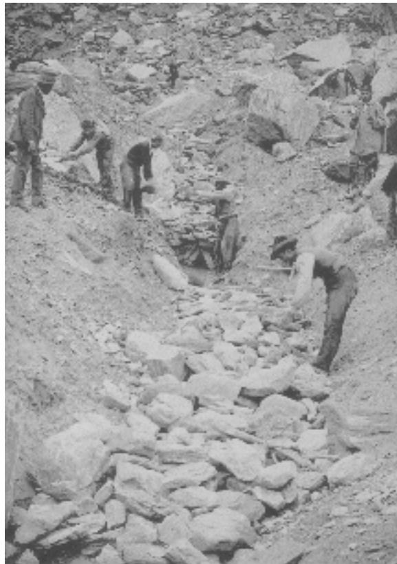
Photographie 3 Construction de drains en 1887. Une branche secondaire. Torrent de Sécheron

Les ouvriers sont presque tous alignés sur une ligne oblique qui sépare, en gros, le chantier (deux tiers) et le terrain naturel (un tiers). Le drain est une autre ligne forte, médiane et verticale, de la photographie. On retrouve le contraste entre l'aménagé, l'ordonné,