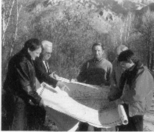
Photographie 9 Extrait d'une brochure contemporaine d'information sur la Restauration des terrains en montagne