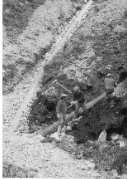
Photographie 10 Extrait d'une brochure contemporaine d'information sur la Restauration des terrains en montagne