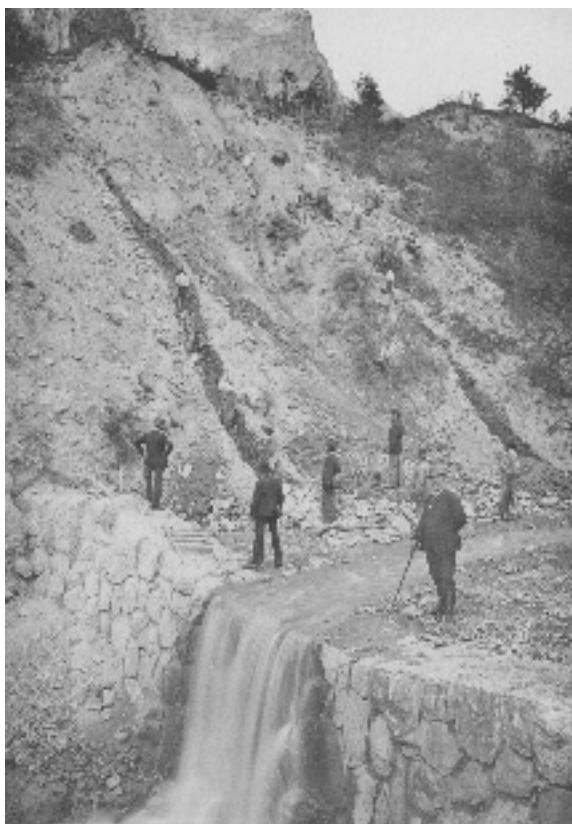
Photographie 7 Drainages en exécution dans les berges du torrent en 1890. Torrent de St-Martin-la-Porte

Entourés par probablement sept forestiers, les six ouvriers sont sous bonne garde ! L'institution forestière, sa hiérarchie, son organisation militaire pèsent