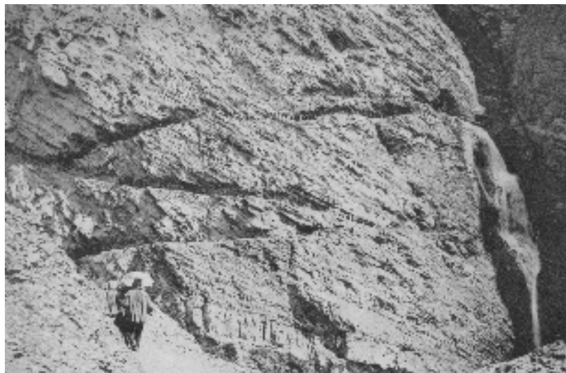
Photographie 4 Torrent de St-Julien - En route pour l'inauguration du tunnel de St-Julien Cliché Charles KUSS, 1896

Les ouvriers étaient recrutés parmi la population locale. On sait que, à l'époque où ils bataillaient pour imposer leur doctrine, les forestiers allaient plus loin que la dénonciation des usages néfastes pour la préservation des terrains ; ils émettaient des jugements de valeur sur cette population : les montagnards étaient routiniers, incultes, égoïstes, paresseux (Larrère, 1993, p. 32) et les forestiers les méprisaient profondément. Cette attitude s'est poursuivie pendant la mise en œuvre des aménagements, la lutte contre les montagnards primant celle contre les phénomènes. Pourtant, il est reconnu que ces derniers avaient depuis longtemps des pratiques de bonne gestion du milieu et ne revendiquaient guère auprès des pouvoirs publics à propos des risques qu'ils subissaient (de Crécy, 1995) : ce sont des voyageurs, des intellectuels, qui ont