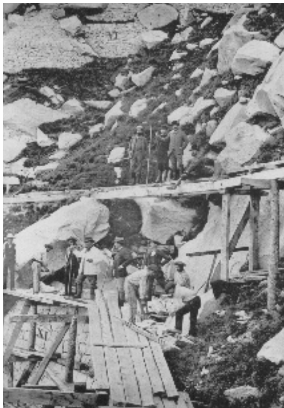
Photographie 1 Groupe XI en construction. Combe de la Péguière

À ce stade, il convient de présenter ce qu'était cette affaire de la Péguière. La combe domine les thermes de la Raillère, près de Cauterets.