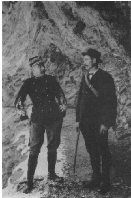
Photographie 8 Construction d'un tunnel. L'agent directeur et le surveillant des travaux. Torrent de St-Julien

sur cette photographie. On peut être surpris cependant que l'uniforme ne soit pas systématiquement porté : selon Métaillié et Richefort (1990), « les échelons supérieurs de l'administration portaient l'uniforme surtout lors d'occasions particulières : inspections, visites officielles ».