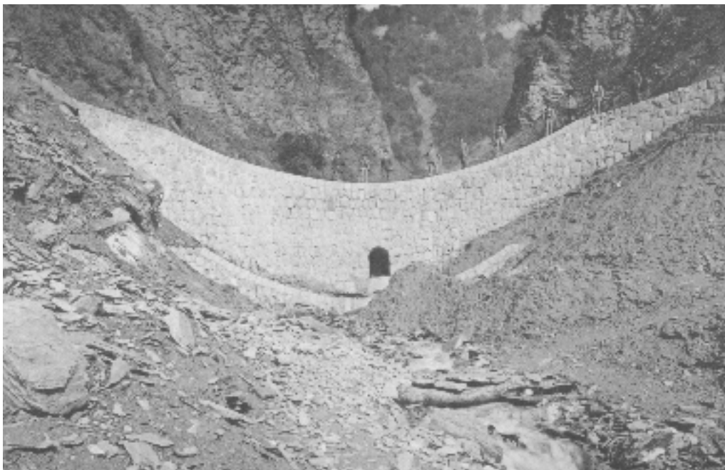
Photographie 5 Barrage n° 4 construit en 1890 - Torrent de Nant Trouble

Il n'y a pas de légende pour cette photographie.