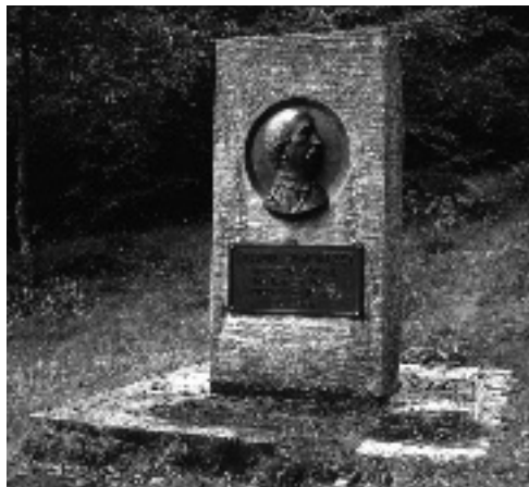
Photographie 11 Combe de la Péguère Stèle commémorative à la mémoire de P. Demontzey Photo S. BROCHOT, 1990

As early as the 1860's, foresters in charge of restoration of mountain land took photographs of the sites they worked on, and established some remarkable collections. Through an analysis of the pictures, this article attempts to cast light on the role and strategy of these men in relation to the public decision-making process concerning this operation, and to gain insight into the sociology of the forestry department. Using a number of photographs depicting individuals, the authors examine the involvement of foresters in 19 th century land planning, their relationships with the local community, their perception of natural phenomena and the cohesion of the institution they belonged to. It is clear from these photograph that foresters went beyond purely technical and propaganda objectives, producing representations, doctrines and fantasies.