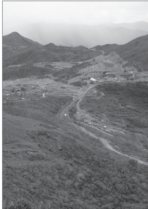
Photo 1 Paysage minier près de Thio

Cependant, une lueur d'espoir subsiste. Certains bouquets riches en Kaori, Agathis ovata (photo 2, ci-dessous), et Araucaria rulei (photo 3, ci-dessous), semblent jusqu'à maintenant protégés alors qu'ils sont en pleine zone d'extraction. Une régénération naturelle s'y installe (photo 4, p. 460). Véritable forêt préhistorique d'ailleurs parfois utilisée comme fond de films de fiction sur l'époque des dinosaures. Souhaitons qu'il n'y ait aucune trace de minerai riche en nickel en dessous.