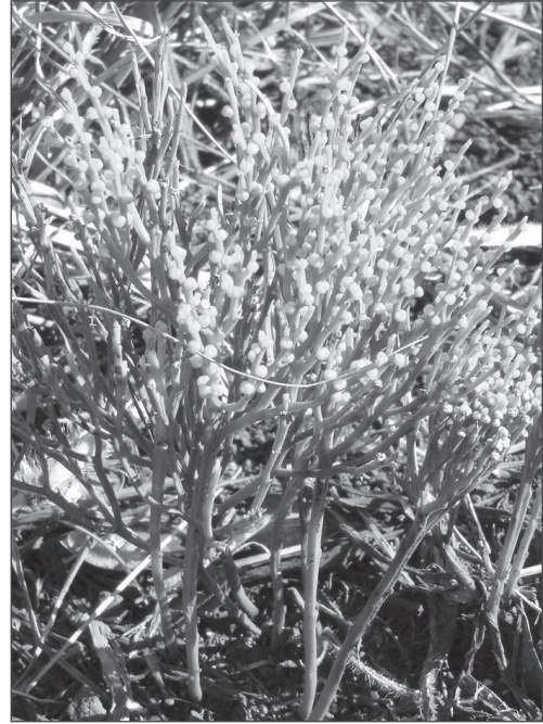
Photo 5 Psilotum nudum , espèce existant déjà il y a 400 millions d'années