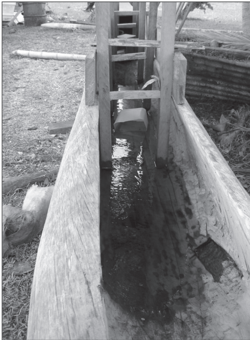
Photo 6 Bateau en Araucaria sur l'île des Pins