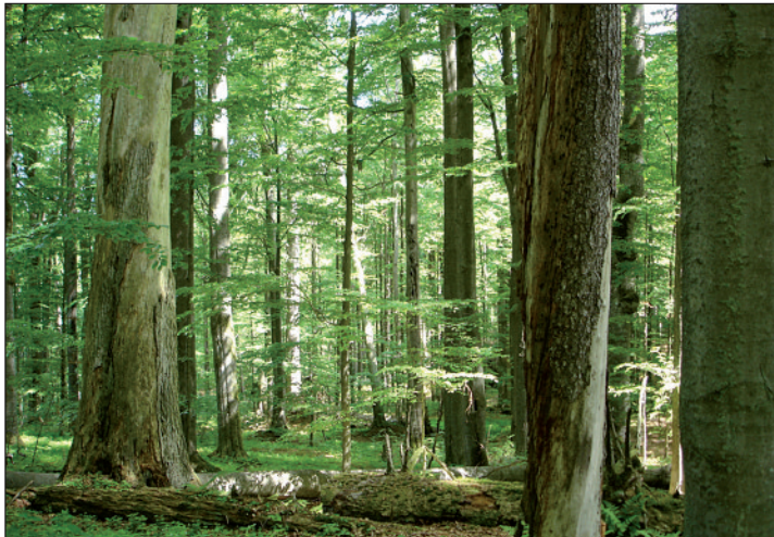
Photo 1. Les forêts les plus naturelles permettent d'étudier les qualités écologiques étant à la base du fonctionnement de l'écosystème forestier. Ici la réserve forestière intégrale la plus ancienne d'Europe (Žofínský Prales, en République tchèque, hêtraie-sapinière-pessière de 98 ha sans exploitation depuis 1838).