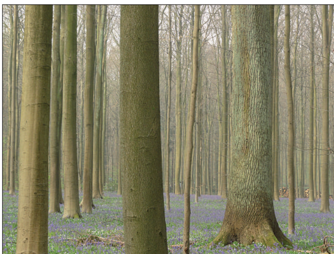
Photo 3. La forêt gérée du bois de Hal, proche de Bruxelles, est à la fois ancienne (d'où le sous-bois dominé par les jacinthes et renoncules) et gérée pour conserver les qualités esthétiques, écologiques et productives en bois (certifié FSC).

Souvent opposées par leurs auteurs, ces deux approches s'avèrent le plus souvent indispensables (et possibles) toutes les deux. Elles sont donc à mieux coordonner, de nombreux intermédiaires existant également en fonction des sylvicultures et des contextes. Dans la pratique, un ensemble cohérent de solutions est mis en avant. Il se fonde sur quatre façons d'agir complémentaires qui sont développées ci-après.