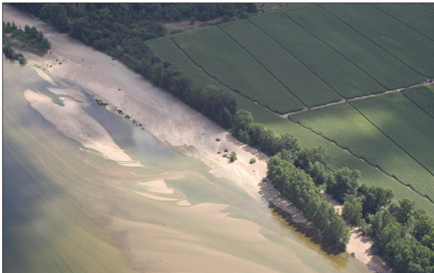
Photo 1 Étroite ripisylve à Peuplier noir de Loire, zone tampon entre l'espace terrestre (occupé par l'agriculture) et le milieu aquatique.

Longtemps confondu et mis à l'écart par le Peuplier hybride de culture, le Peuplier noir ( Populus nigra L.) suscite un regain d'intérêt. Cette espèce fait partie d'un habitat naturel particulier : la forêt alluviale à bois tendre (ripisylve, photo 1, ci-dessous), habitat qui est le support d'une biodiversité remarquable (Piégay et al. , 2003 ; Naiman et al. , 2005). Les caractéristiques biologiques de cette espèce sont présentées dans Villar et Forestier (2009). Suite aux menaces exercées sur le Peuplier noir et son habitat, un programme national de conservation des ressources génétiques a été défini et mis en place par la commission des Ressources génétiques forestières (CRGF) en 1992 sous l'égide du ministère de l'Agriculture et de l'Alimentation. L'objectif principal est de conserver les gènes fondateurs de la variabilité actuelle et de préserver au mieux les adaptations locales comme les mécanismes naturels qui la sous-tendent. Cet article présente les avancées majeures de ce programme depuis 9 ans (Villar et Forestier, 2009).