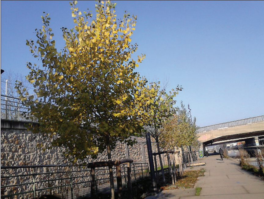
Photo 4 Variété en mélange de clones Seine sur le canal Saint-Denis (Paris).