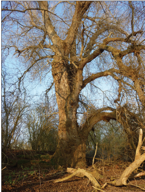
Photo 2 Vieux peuplier noir sur la Seine dans la commune des Muids dans l'Eure (circonférence = 650 cm).