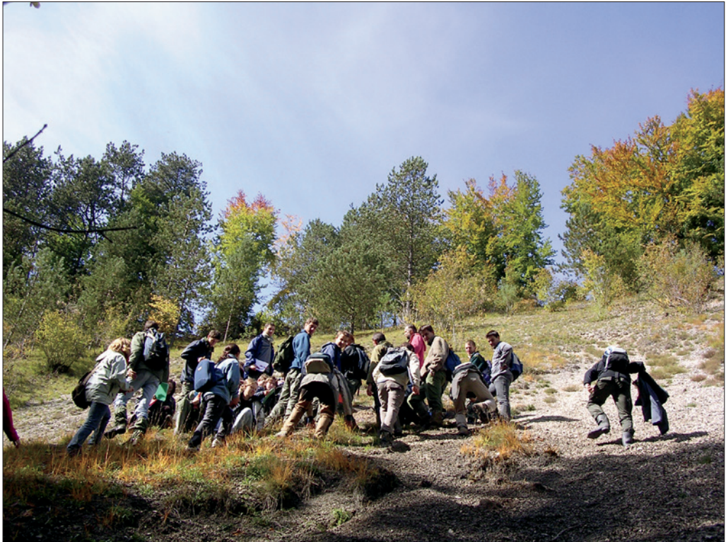
Les étudiants forestiers nancéiens au lieu-dit le Cul du Cerf (commune d'Orquevaux) sur un habitat d'éboulis calcaires