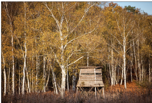
Observatoires de faune sauvage au sein de la zone ouverte au public