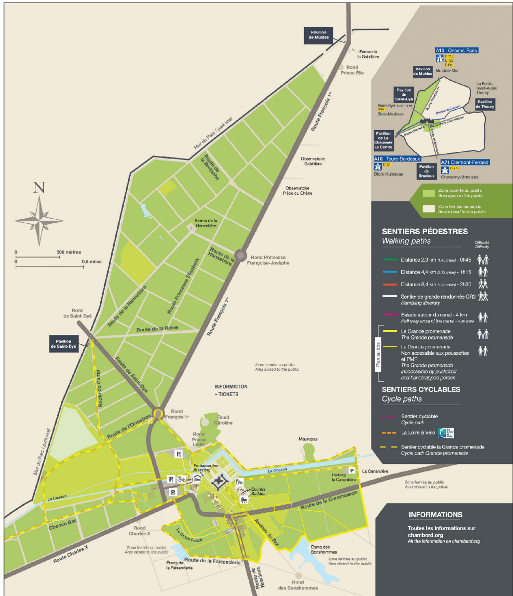
FIGURE 3 PLAN DE LA GRANDE PROMENADE

Quatre observatoires publics (photos, p. 360) ont été aménagés dans les années 1970, le long des routes ouvertes à la circulation publique (route de la Commission et route François 1 er ) afin de permettre au grand public d'observer la grande faune, conformément aux objectifs assignés à la Réserve nationale de chasse et de faune sauvage de Chambord (arrêté de 1974). Un cinquième observatoire a par ailleurs été installé à proximité du château (rond-point Caroline) au début des années 2000. Des miradors plus modestes ont également été mis en place en zone ouverte au public ainsi qu'autour du plan d'eau.