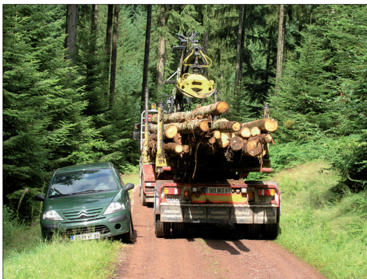
Photo 1 Exploitation dans le massif des Vosges

Dans ce système, toute modification dans la façon de gérer pour mieux répondre à l'une ou l'autre des fonctions interfère souvent avec les autres. Aussi, même si ce numéro de la Revue forestière