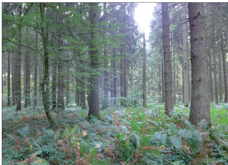
Photo 2 Épicéas dans les Ardennes