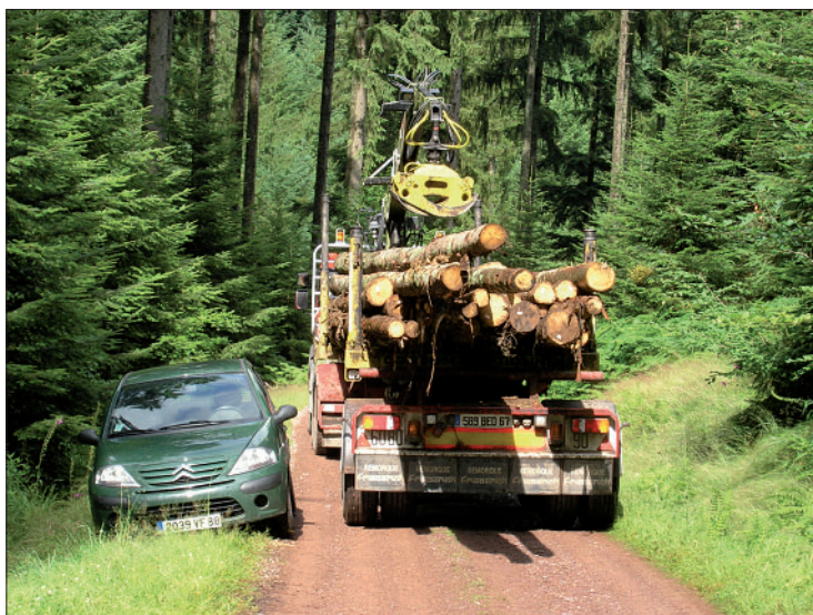
Photo 1 Exploitation dans le massif des Vosges

Dans ce système, toute modification dans la façon de gérer pour mieux répondre à l'une ou l'autre des fonctions interfère souvent avec les autres. Aussi, même si ce numéro de la Revue forestière