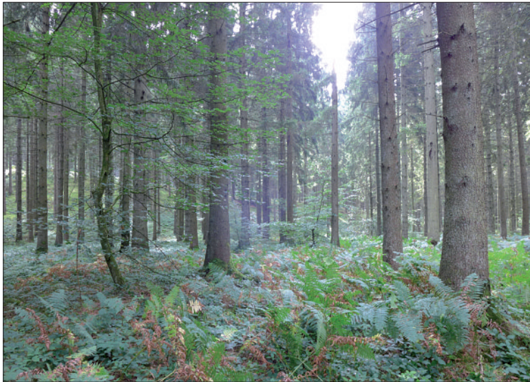
Photo 2 Épicéas dans les Ardennes