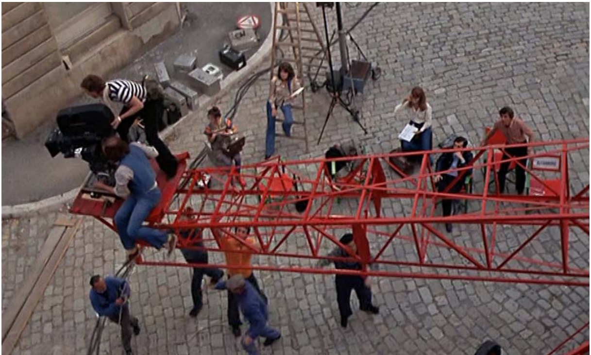
Fig. 3 : La caméra diégétique, sur grue, monte vers nous...

parfois très explicitement, la réflexivité du film (reprise d'un autre métafilm, renvoi aux acteurs réels, mise en scène de la cinéphilie et des références créatives).