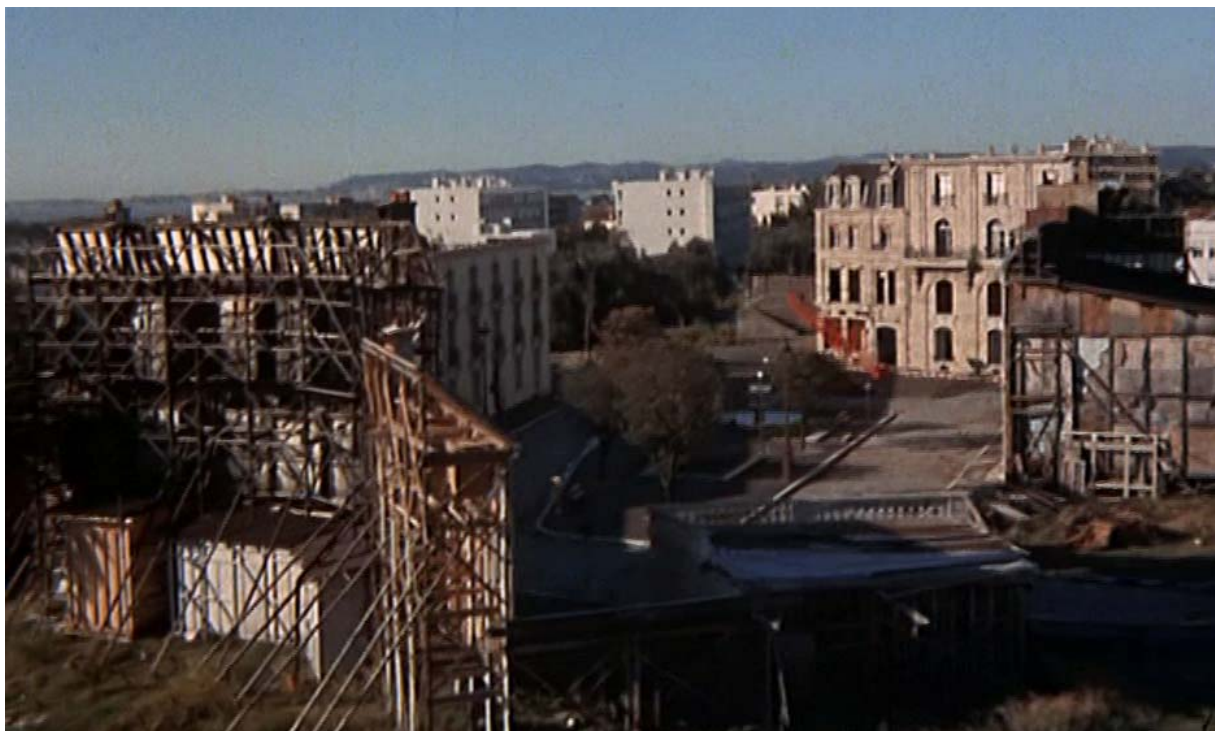
Fig. 2 : L'envers du décor de la place, aux studios de la Victorine.

Montrer le dispositif, le film s'y emploie dès le générique, qui vaut pour un programme d'action, en faisant apparaître son hors-cadre matériel, les ondulations de la piste optique stéréo d'habitude invisible au bord du cadre image (fig. 1), et en donnant à entendre l'enregistrement de sa musique par Georges Delerue. Le générique de fin montre quant à lui