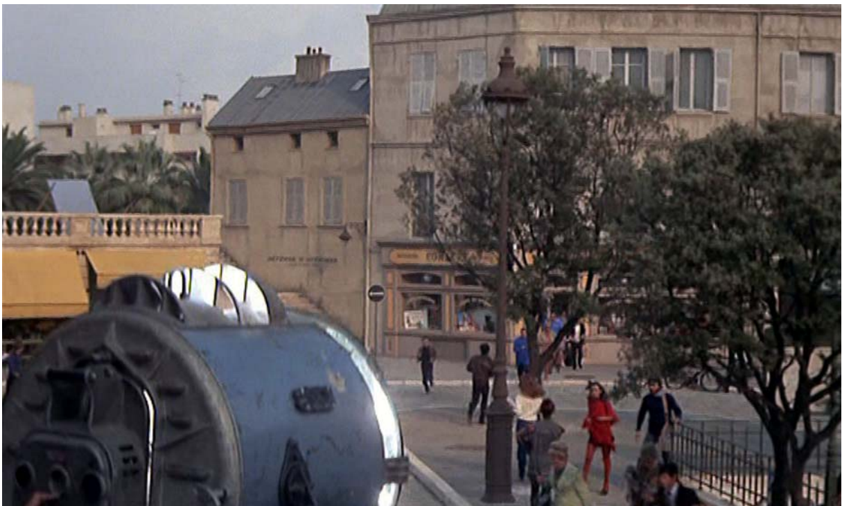
Fig. 6 : Début du plan 4 : la caméra descend le long d'un pied de projecteur...