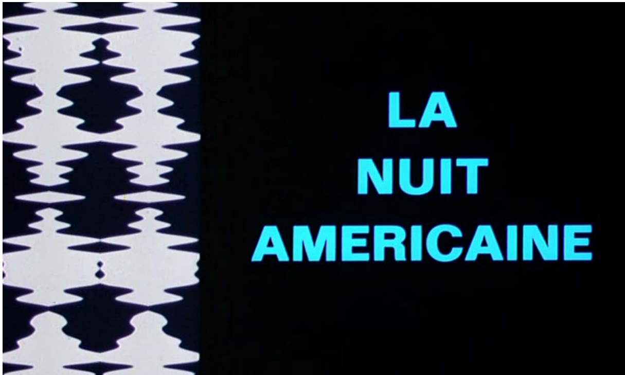
Fig. 1 : La piste optique au générique de La Nuit américaine (toutes les captures d'écran sont extraites de ce film).