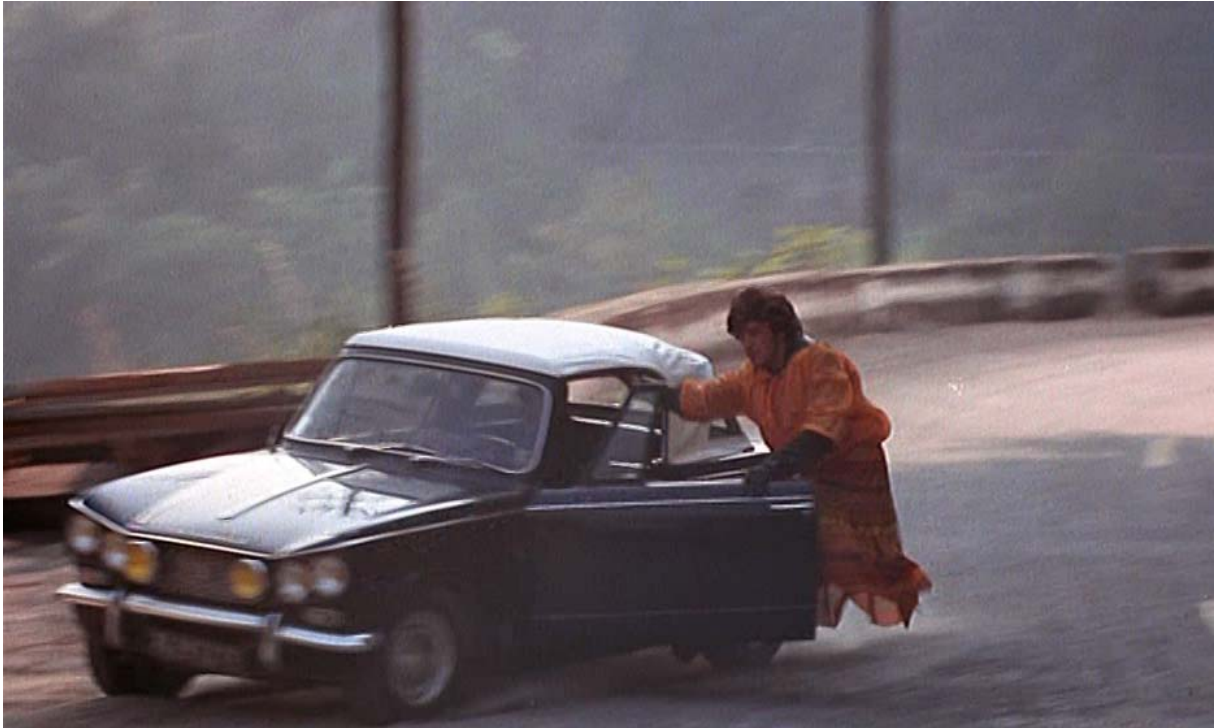
Fig. 9 : Plan de La Nuit américaine montrant le tournage de la cascade de Je vous présente Pamela .