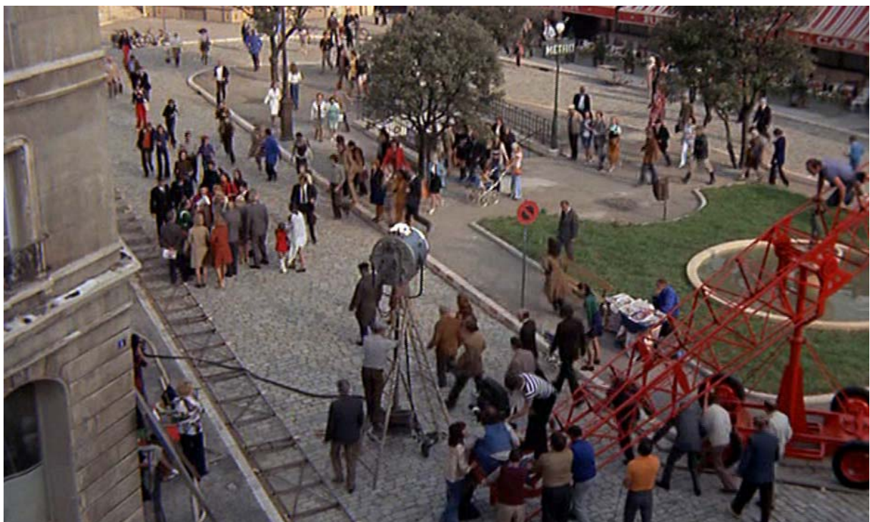
Fig. 8 : Plan 5 : fin de cette action ; la caméra diégétique sur la grue qui vient de filmer le plan 4 (à gauche, les rails de travelling qui ont servi à tourner le plan 1).

Le film multiplie ces moments où caméra diégétique et caméra métafilmique se superposent, se confondent, ou au contraire se distinguent, voire permutent, mettant en évidence la présence du dispositif réel de tournage par-dessus le dispositif fictif. Lors du tournage de la