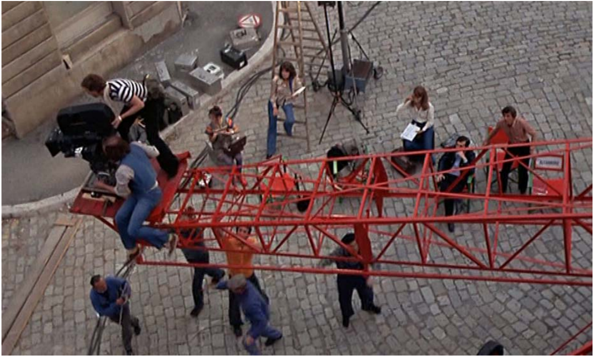
Fig. 3 : La caméra diégétique, sur grue, monte vers nous...

parfois très explicitement, la réflexivité du film (reprise d'un autre métafilm, renvoi aux acteurs réels, mise en scène de la cinéphilie et des références créatives).