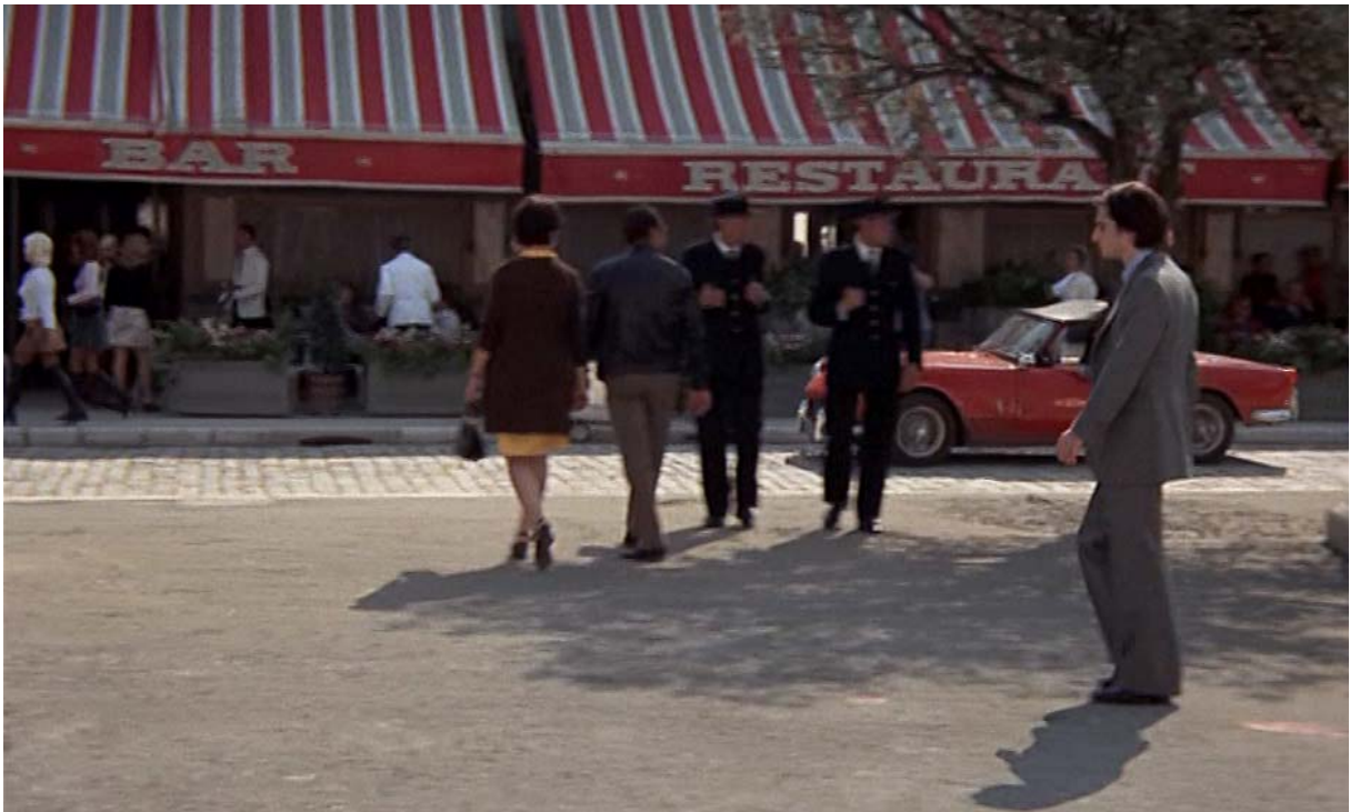
Fig. 5 : Plan 1 de La Nuit américaine : le grand travelling latéral sur la place.