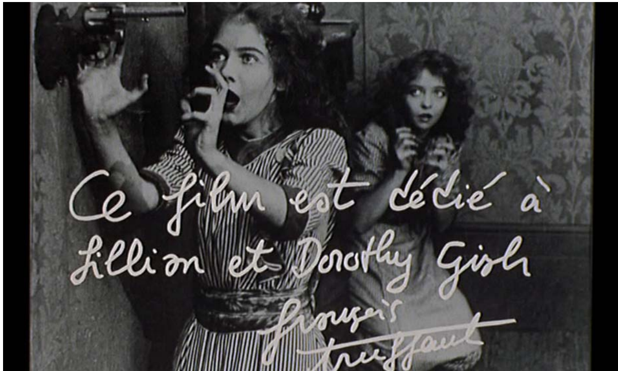
Fig. 12 : Dédicace aux sœurs Gish juste après le générique de début.

Le film marque fortement ses liens au passé : dédicace inaugurale aux sœurs Gish (fig. 12) ; nombreuses références interfilmiques ; histoires de l'âge d'or hollywoodien racontées par Alexandre ; mentions du passé de vedette internationale du personnage de Valentina Cortese ; liens établis entre le producteur et Léon Gaumont, ou entre le réalisateur et ses cinéastes de chevet. Plusieurs personnages sont préoccupés par la filiation : Séverine boit pour oublier la maladie incurable de son fils ; Julie est comparée à sa mère, vedette hollywoodienne ; Ferrand fait la remarque qu'« Hollywood est plein de gens célèbres qui s'efforcent d'être à la hauteur de leurs parents » ; la grossesse d'une actrice suscite les bavardages sur l'identité du père ; Alexandre veut adopter son amant pour qu'il puisse hériter – Jean Cocteau adoptant Édouard Dermit sert de modèle à Truffaut (1973 ; 1988b, 306). La question de la filiation est d'autant plus cruciale dans le film qu'une menace œdipienne y pèse sur les figures de pères, repérée par plusieurs exégètes (Collet, 224 ; Stam 2006, 179 ; Mouren, 97) : le personnage d'Alphonse tue son père ; Alphonse vole sa femme au Docteur Nelson, joué par David Markham, père de Kika Markham, actrice (et amante de Truffaut) sur Les Deux Anglaises et le continent .