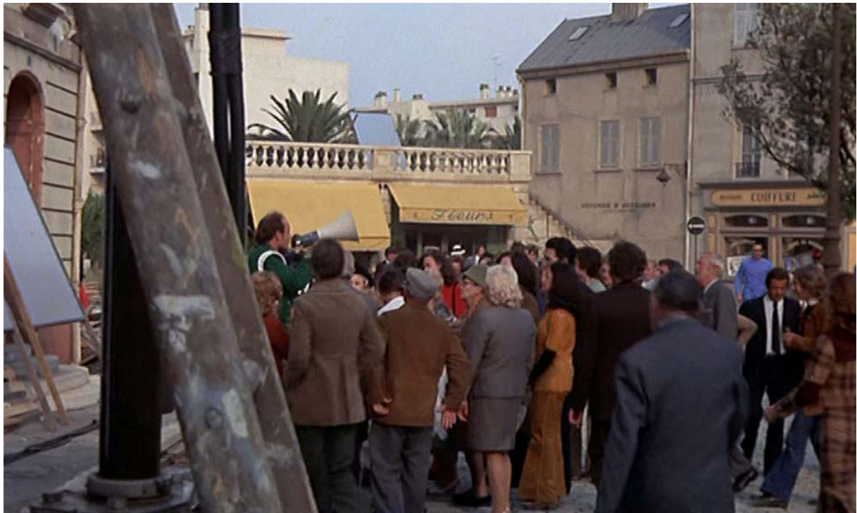
Fig. 7 : Fin du plan 4 : ...jusqu'à l'assistant réalisateur qui appelle les figurants à se rassembler autour de lui.