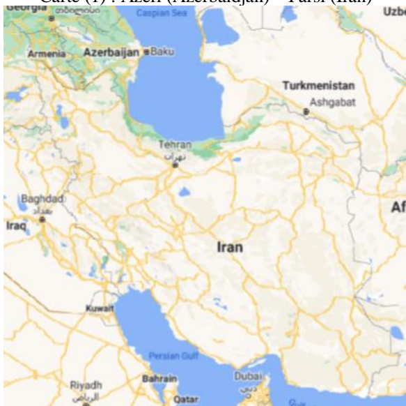
Carte (1) : Azéri (Azerbaïdjan) – Fârsi (Iran)

☞ Objet de l'étude : nouveaux suffixes en persan et en azéri.