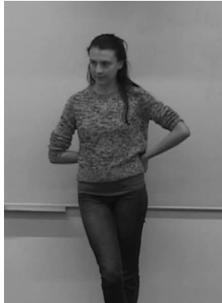
Figure 2 : Une posture instable (Corpus « Corps en Formation »)