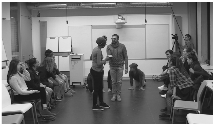
Figure 1 : Expression corporelle (Corpus « Corps en Formation »)

Le module « corps en formation » a été conçu pour la formation initiale d'enseignants de français langue étrangère (FLE) et était composé de la manière suivante : 3h théoriques sur la gestuelle (rapport à la parole, aspects pédagogiques, aspects culturels) et 6h de formation pratique : 2h d'entraînement à l'explication lexicale et délivrance de consignes (en laissant d'abord les étudiants faire librement puis en réfléchissant à la façon dont leur corps pouvait contribuer à ces actions), 1h de travail sur le corps et l'expression corporelle, 1h de travail sur voix et posture, 1h d'autoconfrontation (faite collectivement à partir d'extraits vidéo issus des 2 premières séances) et enfin 1h de travail sur l'explication lexicale et la délivrance de consigne en intégrant les aspects abordés dans la formation. Le dispositif s'est étalé sur 6 semaines à l'automne 2017 et a été intégralement filmé par deux caméras offrant des points de vue différents. La Figure 1 est extraite de la séance consacrée au travail sur l'expression corporelle.