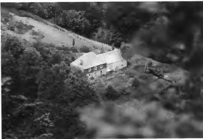
Maison du Coin de la scie à Borée. Vue du Rocher des Pradoux