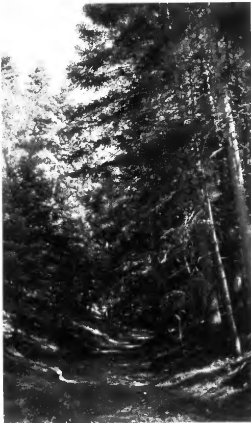
A gauche : sapinière du Mainalon. A droite : Sapin de Céphalonie (arbres isolés).