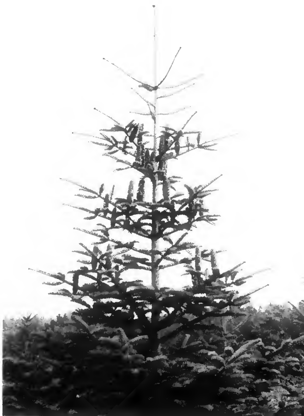
Sapin de Céphalonie, provenance Mainalon, à Pélénq (Var). Noter la longueur des pousses annuelles (arbre de 20 ans).

Reste, bien sûr, le problème de la lenteur de la croissance juvénile qui peut se faire sentir jusqu'à 15 ou 18 ans (Fady et al. , 1991). Ce point mérite réflexion. Tout d'abord, l'estimation des paramètres génétiques (Fady, 1991) a montré qu'une sensible amélioration de la croissance en hauteur, notamment juvénile, pourra être attendue sur les plants issus de graine améliorée lorsque le verger à graines de Saint-Lambert (Vaucluse) sera productif. Ensuite, l'existence d'une compétition avec la végétation naturelle dans le jeune âge est souvent évoquée, d'où l'obligation d'entretiens répétés fréquemment. En fait, la compétition avec les arbustes (Chênes kermès, Cytises, Ronces) semble au contraire profiter au jeune plant du fait de l'ombrage offert par l'arbuste, du moins une fois que le plant est installé. La seule compétition sérieuse pour l'alimentation en eau au moment de l'installation provient du tapis graminéen. L'utilisation d'un paillage approprié à la plantation (composition et forme à définir : film plastique, dalle de bois aggloméré, disque plastique rigide en forme de cuvette, copeaux de plastique ou de bois, etc.) pourrait réduire cet impact, améliorer le bilan hydrique et éliminer une partie des entretiens dans le jeune âge. Il engendrerait bien sûr des dépenses supplémentaires, mais mieux vaut planter peu d'arbres dans les meilleures conditions possibles.