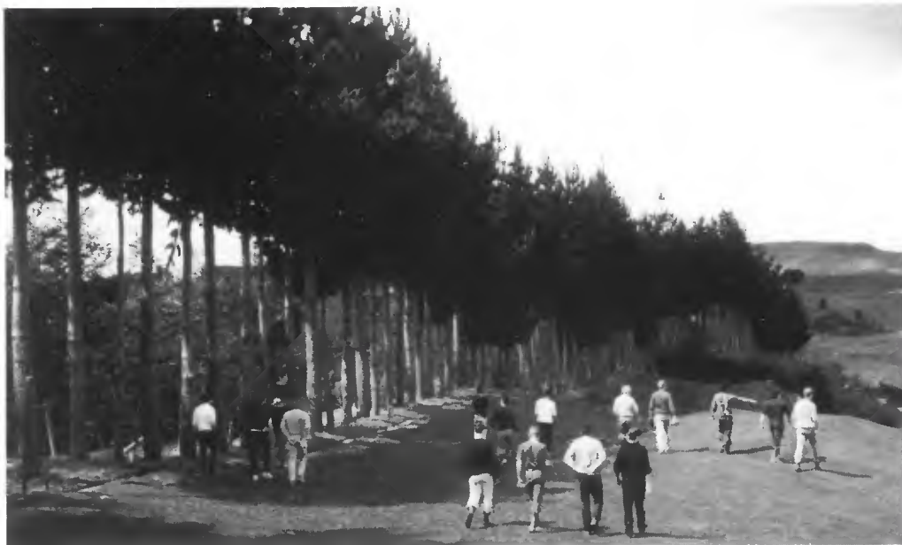
Photo 2 Haie de Pinus radiata de 9 ans. Arbres espacés de 2 mètres, strate inférieure de Mélézes.