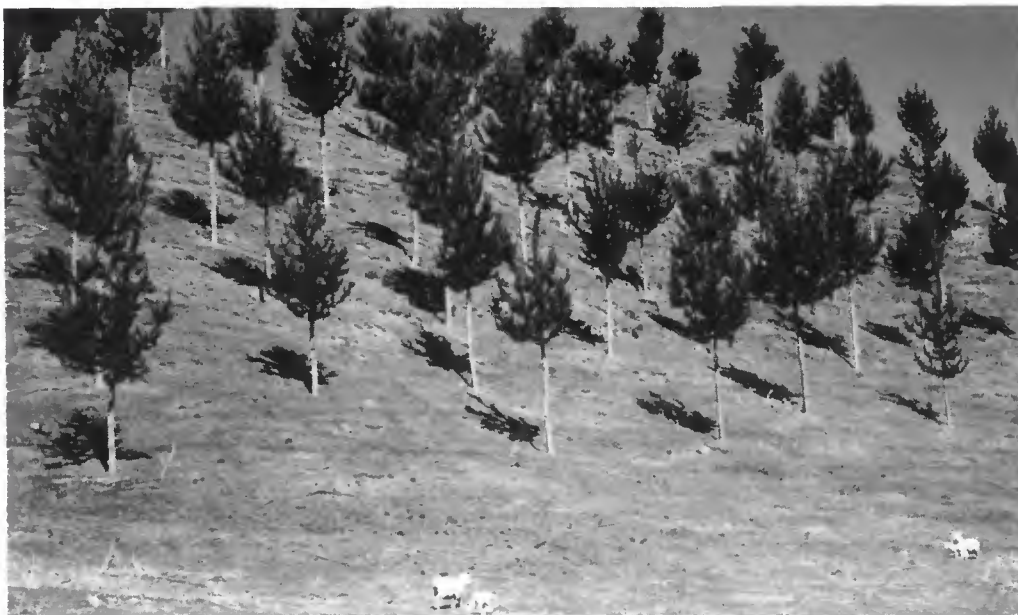
Photo 4 Plantation à densité quasi-définitive en prairie (ferme de G. Brann, Te Puke, Bay of Plenty, centre-est de l'île du Nord). Arbres issus de boutures réalisées par l'agriculteur, âgés de 6 ans, élagués tous les 8 mois.

Le critère majeur de qualité du bois produit est la cylindricité du cœur défectueux de la bille, et secondairement la réduction du diamètre de ce cœur. Cette cylindricité permet en effet des rendements excellents en déroulage. Le critère technique utilisé est le « diamètre sur chicots » (DOS : « Diameter Over Stubs »), qui est le plus grand diamètre au niveau d'un verticille après élagage. Par des élagages précoces et fréquents, le cœur avec défauts est réduit à l'extrême. Les ouvriers utilisent pour cela une jauge de 7 à 12 cm (généralement 9 à 10 cm), et élaguent à chaque passage tous les verticilles qui se trouvent en dessous du premier point où le diamètre