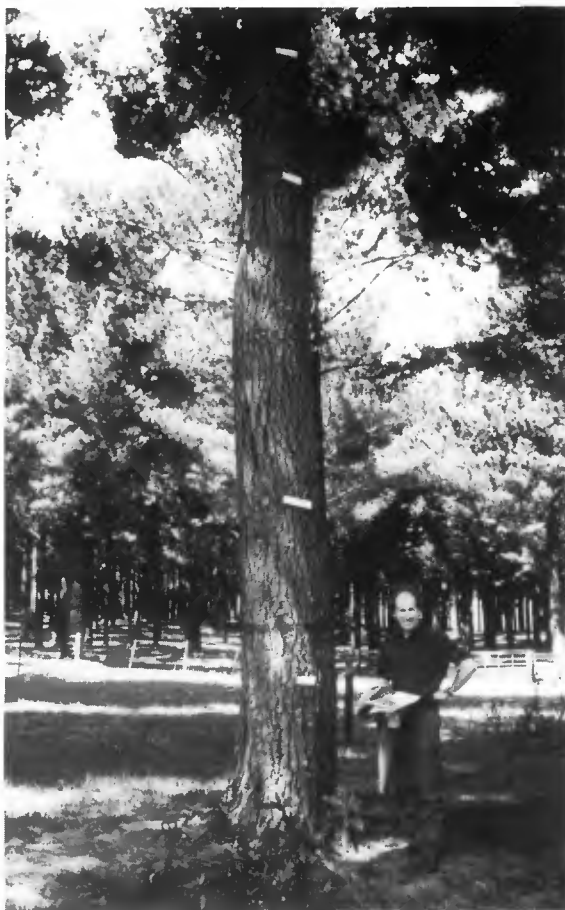
Photo 5 Arbre de 17 ans à la densité de 50 arbres/ha, élagué à 8 mètres à Tikitere, centre de l'île du Nord. Le diamètre du cœur avec défauts est indiqué par les marques blanches.

Le problème principal pour l'éleveur est l'irrégularité de la production pastorale dans les parcelles agroforestières. Cette production peut varier brutalement (négativement par suite d'une forte chute d'aiguilles, positivement après une éclaircie).