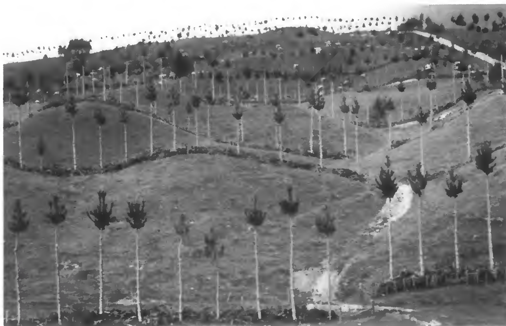
Photo 3 Redécoupage d'une exploitation laitière avec des haies productrices de bois de qualité (ferme de I. Moore, Ngongotaha, centre de l'île du Nord). Les arbres sont âgés de 5 ans et le 3 e élagage vient d'être effectué. La bille de pied de 6 mètres est acquise sur la plupart des arbres.