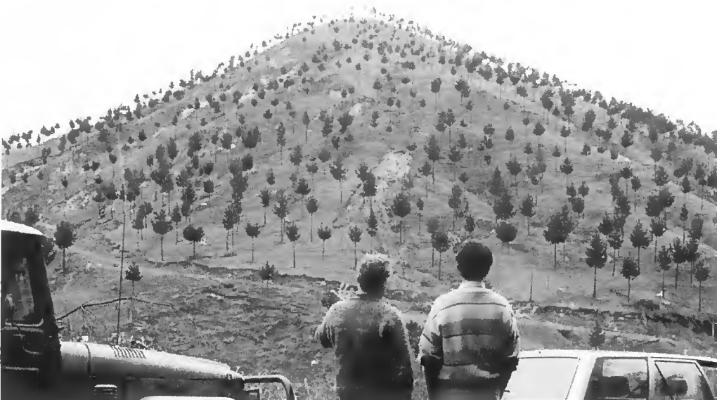
Photo 1 Reboisement agroforestier sur terrain érodé. Woodstock Station, Hawkes Bay, sud-est de l'île Nord de la Nouvelle-Zélande.

Le point commun majeur entre les approches néo-zélandaises et françaises est l'objectif de production de bois de qualité par l'agroforesterie (il peut exister d'autres productions, champignons, fruits,... qui ont un caractère plus marginal). L'agroforesterie ne doit pas se contenter