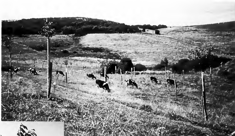
Photo 3 Vue d'ensemble d'un verger à bois pâturé de 3 ans. Orcival (Puy-de-Dôme).