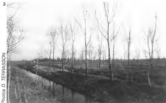
3 - Peupliers blancs de 9 ans, en bordure des fossés de drainage.