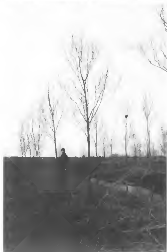
6 - Difficulté d'élagage chez les Peupliers de la section Leuce.