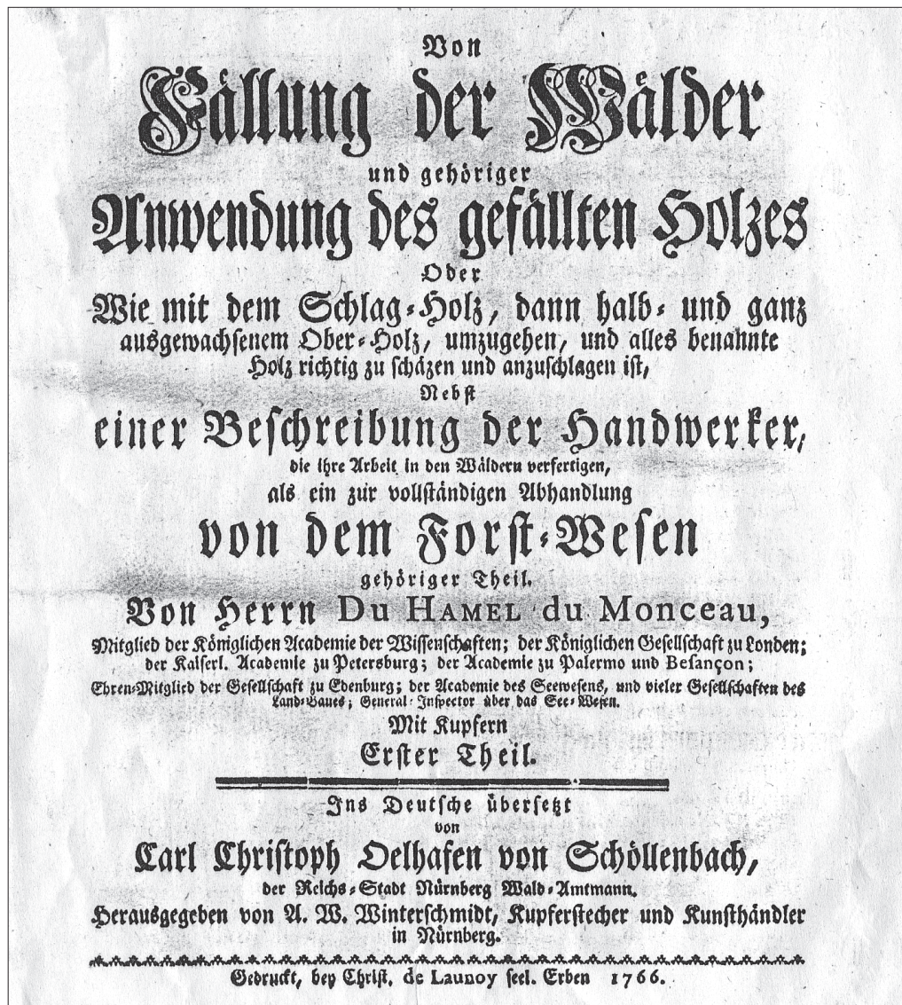
Page de garde de la traduction allemande du livre de Duhamel du Monceau "De l'exploitation des bois", publié deux ans seulement après l'édition française