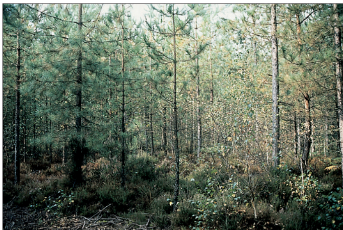
PHOTO 2 Type de milieu S8 : sol très acide avec abondance de la Callune. Le peuplement est clair et assez hétérogène, avec un accompagnement ligneux limité au sous-étage et à l'étage dominé