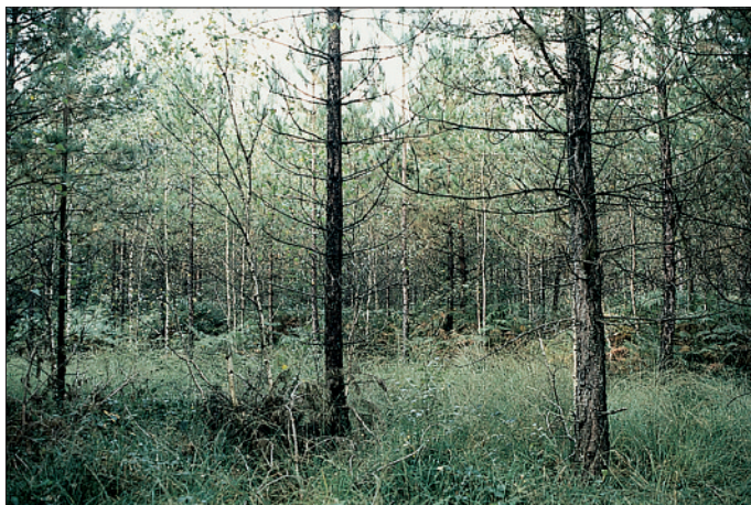
PHOTO 1 Type de milieu S1 : sol hydromorphe et acide avec abondance marquée de Molinie. Le peuplement est très clair et hétérogène, avec un fort accompagnement de bois blancs dans l'étage dominant