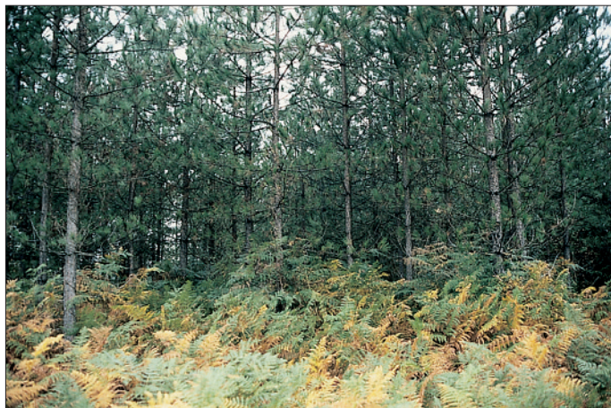
Photo 5 Type de milieux S13F : sol acide avec tapis continu de Fougère aigle. Le peuplement de Pin laricio est homogène et présente une bonne croissance. L'accompagnement ligneux est très faible