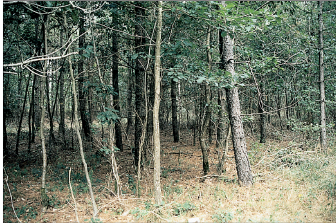
Photo 4 Pour le type de milieux S13N, les feuillus de l'étage dominant ont un facteur d'élanement élevé et peuvent se courber suite à la première éclaircie

Photo 3 Type de milieux S13N : sol acide. Le peuplement de Pin laricio est homogène et présente une bonne croissance. L'accompagnement ligneux est assez abondant dans tous les étages, avec une forte proportion de Chêne