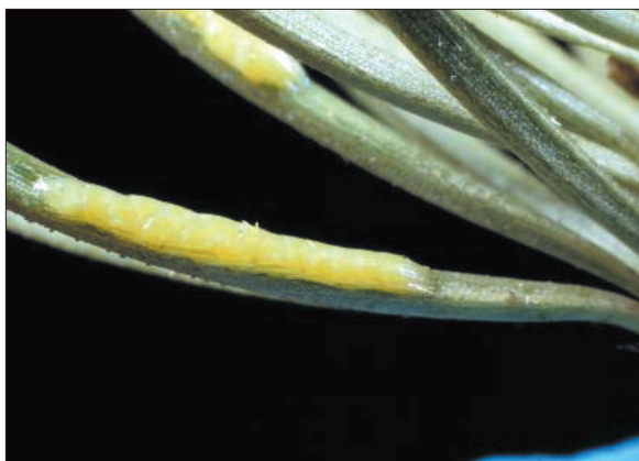
PHOTO 2 Ponte de Dichelia cedricola