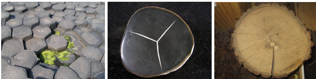
FIGURE 1 – Exemples de fissures naturelles en forme d'étoiles : colonnes basaltiques (Chaussée des Géants, Irlande), septaria, tronc d'arbre (musée de Besançon, photo prise lors de CFM 12)

Mots clefs : brittle fracture, minimisation principle, crack shape