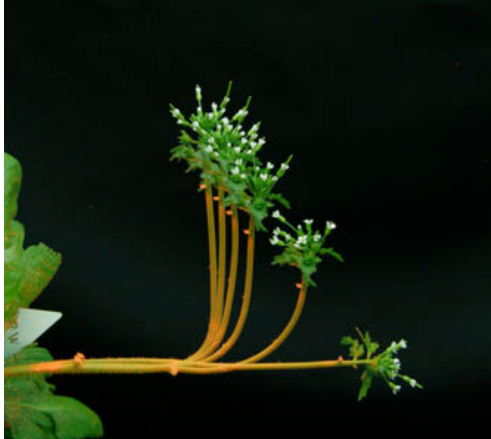
FIG. 3 Formes successives d'une inflorescence de l'arabette des dames ( Arabidopsis thaliana ) au cours de son redressement après une inclinaison à l'horizontale. On voit nettement que l'ensemble de la tige commence par se courber vers le haut, mais ensuite la partie haute se rectifie progressivement et la courbure se concentre à la base (taille de la hampe = 10 cm, durée totale 20h)