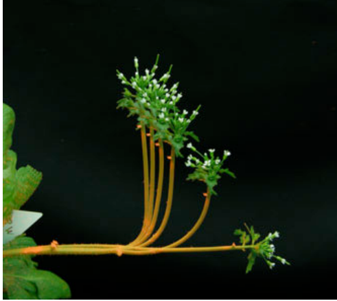
FIG. 3 Formes successives d'une inflorescence de l'arabette des dames ( Arabidopsis thaliana ) au cours de son redressement après une inclinaison à l'horizontale. On voit nettement que l'ensemble de la tige commence par se courber vers le haut, mais ensuite la partie haute se rectifie progressivement et la courbure se concentre à la base (taille de la hampe = 10 cm, durée totale 20h)