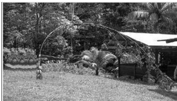
FIG. 1 – Illustration du flambement d'Euler chez un jeune arbre du sous bois tropical ([3])