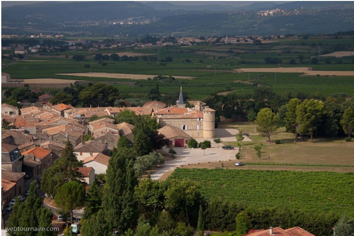
Fig. 9 : Château de Jonquières