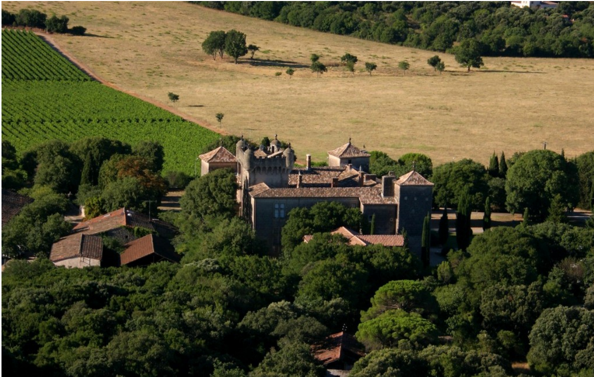
Fig. 12 : Chateau de Cambous