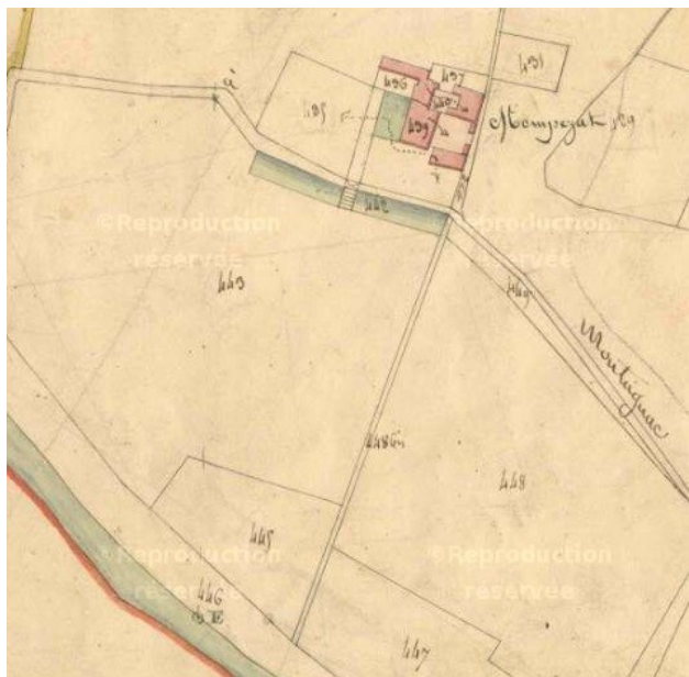
Fig. 6 : Château de Monpezat, Section E2 du cadastre de 1827, Archives départementales de l'Hérault.

Le cadastre n'est pas très éloquent quant à l'ordonnement spatial du château de Larzac, ou métairie Thomas, qui domine la vallée de la Peyne depuis son coteau méridional aménagé en terrasses 47 . Sous la cour de cette maison, reconstruite au début du XVII e siècle par un intendant des Montmorency, se trouve une citerne alimentée par