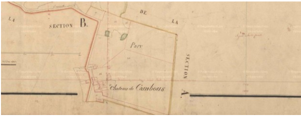
Fig. 11 : Chateau de Cambous, Section A2 du cadastre de 1829, Archives départementales de l'Hérault.

siècles. L'aile sud a été remaniée au XVIII e siècle. Antoine de Cambous est un catholique engagé qui reprend une forteresse en 1584. La générosité royale lui permet de reconstruire son château de Cambous qui, trois siècles plus tard, sera au centre d'un territoire de près 24 km 2 d'étendue. Le fils aîné d'Antoine de Cambous n'ayant pas d'héritier, le domaine passe à sa sœur Marguerite, mariée à Jean de Ratte, fils du viguier de Gignac, qui combat également le parti huguenot 69 . Le quadrilatère, cantonné de trois tours rectangulaires que forme le château délimite une cour intérieure Renaissance à arcades, agrémentée d'un puits. L'aile est, est constituée, en partie, par le donjon du château médiéval et l'angle nord-est ne possède pas de tours. Les façades sont percées de fenêtres à meneaux non sculptées, comme souvent dans le Languedoc méridional. À l'ouest, la façade principale s'ouvre en revanche par une porte très ouvragée. Au nord la majorité des terres sont rocailleuses et parsemées de bergeries, pâtures et devois (enclos pour les agneaux). Le château est élevé à l'angle d'un vaste parc de chasse de 10 ha dans lequel sont indiqués deux « lacs » sans doute un vivier et une lavogne (abreuvoir) pour le gibier ou les ovins. La parcelle 32 est