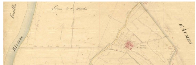
Fig. 7 : Château de Saint-Martin, section B1 du cadastre de 1827, Archives départementales de l'Hérault.

une galerie sous-terraine qui traverse le jardin, puis se prolonge au-delà vers la métairie ou château St-Julien, abritant une orangerie de la fin du XVI e siècle, dont on peut attribuer la construction à Guillaume de Bizerobert 48 . En suivant le Val de Peyne sur sa rive méridionale le château de Peyrat ou métairie Montplaisir se trouve sur la commune de Tourbes. Il s'agit d'une propriété de la famille de Peyrat, établie à Pézenas dès le XV e siècle. Se trouvant en plaine il n'offre pas de vue dominante particulière. L'adjonction de tours au XVI e siècle transforma cette ferme en maison forte, embellie et agrandie au XVII e siècle. Le logis s'organise autour de deux cours carrées de même dimension, la « cour du propriétaire » et la « cour du fermier » 49 , dont les bâtiments disposaient de tourelles aujourd'hui disparues. Le plan de masse des cultures de l'an XIII montre un domaine qui s'étend jusqu'au ruisseau de Rièges qui débouche dans la Peyne. On y distingue au sud un jardin, des terres labourables, des vignes et un bois. Le jardin, qui semble disposer d'un bassin en son centre et d'un autre en bordure au sud, se développe en forme de trapèze à l'ouest sur la parcelle 916, dans le prolongement des deux cours du logis. Le parc dénommé enclos occupe environ 10 ha et ne semble pas encore traverser par son allée axée sur la demeure.