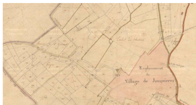
Fig. 8 : Château de Jonquières, Section A du cadastre de 1824, Archives départementales de l'Hérault.

Dans le Lodévois, non loin de Pézènes, au sein d'un paysage montagneux de forêts de chênes verts, le château de Lavalette d'origine médiévale a été reconstruit au moins partiellement en 1585, suite au siège mené par les troupes du duc de Joyeuse. Une grande campagne de restauration a dû se tenir dans le second quart du XVII e siècle 60 . Le château de plan massé à tourelles est situé côté village dans l'angle d'un parc d'1 ha. Au sud, il est aujourd'hui orné d'un parterre quadrangulaire de 2 000 m 2 (parcelle 68) de l'autre côté de la cour d'honneur (parcelle 70), dans le prolongement de l'aile principale du bâtiment. Une terrasse panoramique, se trouve au nord sur les parcelles 108 et 109 alors que le jardin sud n'offre pas de vues sur le paysage.