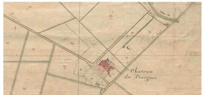
Fig. 2 : Château de Preignes, section A2 du cadastre de 1823.

minée par un canal nommé « ravin du puits ». Le jardin se répartit sur trois parcelles qui portent la mention « le jardin ». Nous pouvons admettre, en nous fiant à l'atlas de l'état-major que la parcelle carrée 231, faisant front au plus près de la façade nord du château, qui est entouré d'allées en buis dans le terrier de 1774 36 , était compartimentée en carreaux. À son extrémité se trouve une chapelle, comme dans plusieurs jardins des châteaux du Val de Loire notamment. Une parcelle de jardin moins régulière est juxtaposée en 236 : elle accueille des noyers en 1774. Fait suite une autre parcelle en 235 séparée des « arbres blancs » en 347, par le ruisseau de la Garenne. L'ensemble de ces parcelles bonifiées s'étend sur 350 m de long, soit environ 5 ha. Au-delà se trouve « la Garene ». Au nord sur une parcelle non irriguée sont plantés des amandiers. L'organisation spatiale est donc non seulement réalisée en fonction de l'adduction d'eau, mais aussi d'une organisation géométrique et scénographique.