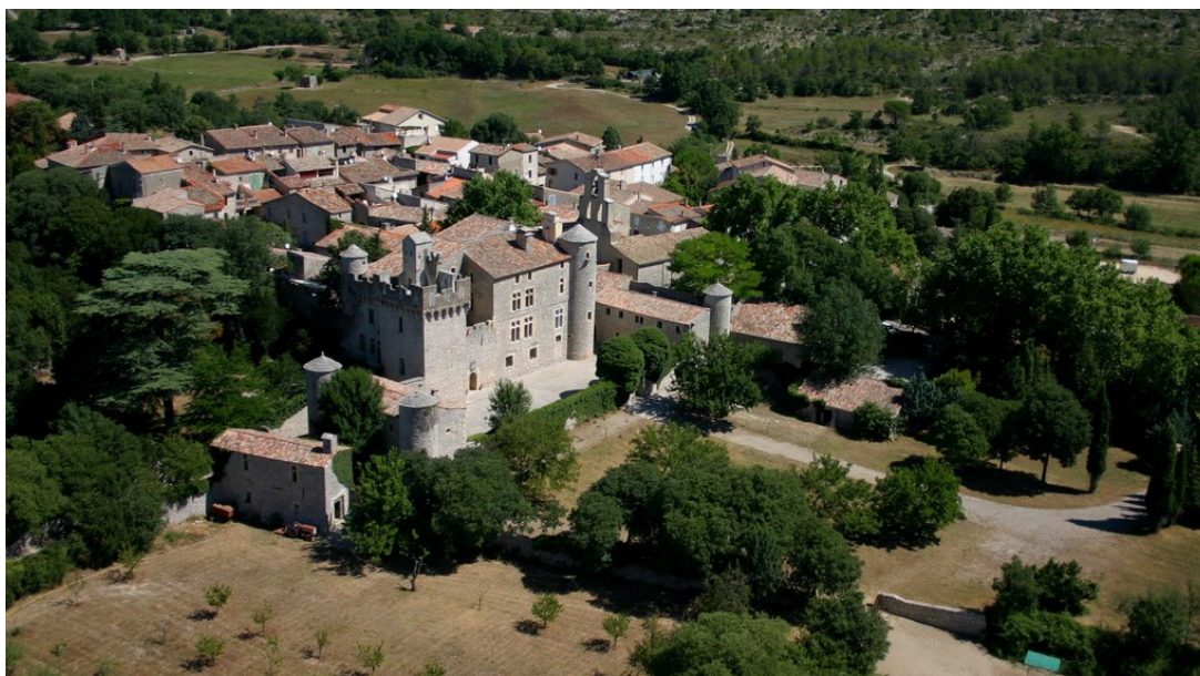
Fig. 13 : Château de Notre-Dame-de-Londres

au parc du château, s'étend sur 3 ha dans le prolongement du précédent jardin jusqu'à la Tourquille. À l'ouest, un autre jardin, aujourd'hui un verger, s'étend sur les parcelles 183 et 184 et comprenait un vivier. Le parc qui occupe le tènement de « la Garenne » sur 5 ha est axé par un chemin qui le divise en deux parties quasiment égales sur les parcelles 248 et 248bis. À l'extrémité orientale du département, à quelques kilomètres au nord de Notre-Dame-de-Londres le château de Saint-Bauzille-de-Putois est également situé dans un paysage accidenté de garrigues au nord des gorges de l'Hérault au bord du causse de Taurac. Ce château, incorporé au tissu urbain, fut construit vers 1643 par Jean de Valat, prieur de Valleraugue, accusé selon la tradition locale, d'avoir utilisé les pierres du temple et incorporé un cimetière dans son parc. Son logis, de plan rectangulaire à deux niveaux flanqués de tours rondes et d'un donjon carré, évoque celui de Cambous situé à peu de distance 71 . Édifié au sud du village sur le cadastre ancien, il dispose d'un vaste parc structuré par deux allées en angle droit au départ du château. Ce parc, qui s'étend sur 3,2 ha, correspond aux parcelles 386 et 387. Les emplacements du jardin à labyrinthe de buis et du système hydraulique qui font l'objet d'un classement ne se distinguent malheureusement pas sur le cadastre.