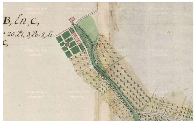
Fig. 3 : Château de Roquelune, Archives départementales de l'Hérault, C 4283-1 Pézenas : cours de la Peyne. 1748 (détail).

terrain et à la déclivité. Le jardin se développe à l'arrière du corps de logis dans un enclos carré de 1 200 m 2 . Roquelune ou « Campagne de Boudon » sur le plan de masse des cultures, est une ancienne résidence de la Famille de Boudoul, capitaine-châtelain de Pézenas au XVII e siècle. Dans le compoix de la Coste de 1688 elle fait partie d'un domaine au tènement de « Roquelunas » comprenant, d'un côté du Rieurtort, « maison, écurie, deux cours, jardin, vigne, olivette, champ et bois de rivage », de l'autre côté, « un pigeonnier moulin à blé avec deux meules non moulans (ne broyant plus), étable, poulailler, cazal (bâtiment à demi ruiné), cour, jasse (bergerie) patus (cour) au-devant, jardin verger, vivier, aire, pré, champ, olivette, bois de rivière et herme » 45 . Le cadastre montre nettement le parti d'ordonnement du jardin d'1,7 ha situé au-devant de la demeure, puisqu'une allée le divise quasi symétriquement sur 170 m (fig. 3 et 4)