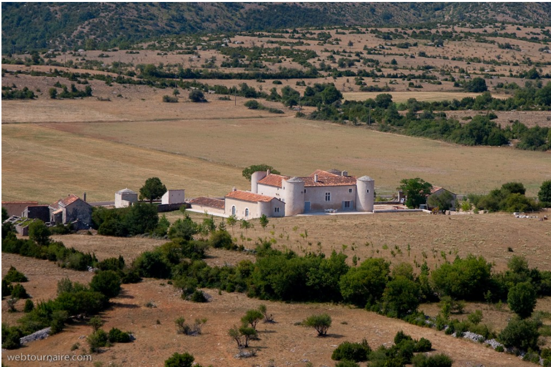
Fig. 10 : Château de Sorbs