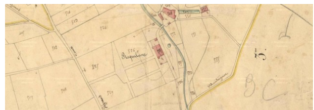
Fig. 4 : Château de Roquelune, Section E2 du cadastre de 1827, Archives départementales de l'Hérault.

(parcelles 525, 526 et 529). Une autre allée le recoupe orthogonalement sur sa moitié sans déformation longitudinale. On remarque également un bassin au-devant du logis et un vivier près des dépendances. Roquesol, ou « métairie Bonnet », dont l'histoire n'est pas connue avec précision est un bâtiment agricole construit sur un terre-plein d'une mise espace beaucoup plus modeste, selon le cadastre napoléonien. En 1521, Jean de Montpezat possède une grange et son moulin sur la Peyne. En 1627, André de Juvenel, secrétaire du duc de Montmorency, l'obtient et en 1646 alors qu'elle appartient à François de Carrion-Nizas, elle est vendue aux pères de l'Oratoire, puis rachetée en 1654 par Félix de Juvenel. Le château actuel daterait de 1880 mais les abords correspondent aux aménagements du XVII e siècle. Montpezat comportait une maison d'habitation, deux tours servant de pigeonniers, une écurie et un jardin clos, séparés par une