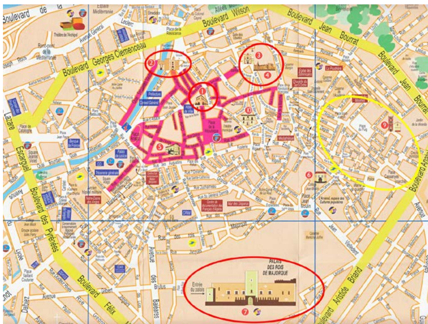
Carte touristique du département des Pyrénées Orientales

En dehors de Perpignan, Collioure, village sur le bord de mer apparaît incontournable tout comme Villefranche de Conflent, ville fortifiée par Vauban.