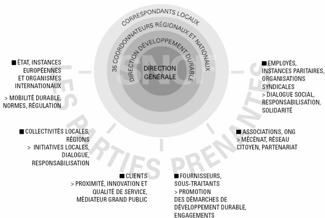
Figure 2 : la mise en œuvre du développement durable à la SNCF