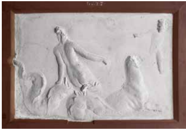
3. Naples, Museo Archeologico Nazionale. Néréide vue de dos chevauchant un monstre marin accompagné par un Eros volant (38 × 55 cm, MANN 9627)