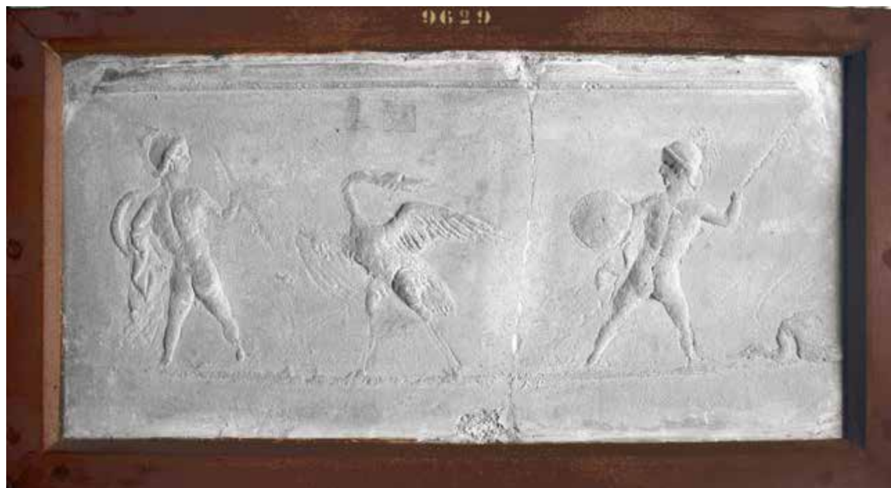
7. Naples, Museo Archeologico Nazionale. Combat de pygmées et de grues (31 × 66 cm, MANN 9629)

mais on peut supposer qu'il s'agissait de personnages dont la fortune reposait sur l'activité commerciale de la zone: un dynamisme économique qui perdure jusqu'au II e siècle, quand l'ouverture des nouveaux ports de commerce à Ostie (de Trajan) et Civitavecchia entraînent le début de la décadence de Puteoli, déchu de son rang de port de première importance de l'empire. Le ralentissement économique correspond à un ralentissement artisanal et c'est aussi durant le courant du II e siècle que les décorations en stuc sont de plus en plus rares, même si les tombeaux continuent d'être utilisés jusqu'au III e siècle au moins.