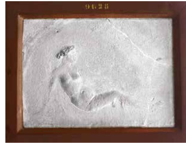
5. Naples, Museo Archeologico Nazionale. Stuc représentant un décor similaire de femme à moitié allongée (31 × 66 cm, MANN 9628)