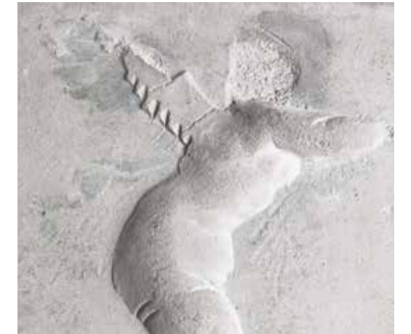
2.a-b. Naples, Museo Archeologico Nazionale. Eros sur cheval marin (38 × 60 cm, MANN 9626) et détail de la figure de l'Eros avec les traces du fond bleu visible là où le motif stucé a disparu

C'est peut-être dans cette optique que les stucs conservés dans les réserves du Musée ont été sertis de cadre épais en bois marron foncé, à moins que l'encadrement ne soit lié à une opération de consolidation du support ? En tout cas, on distingue deux types de mises en valeur.