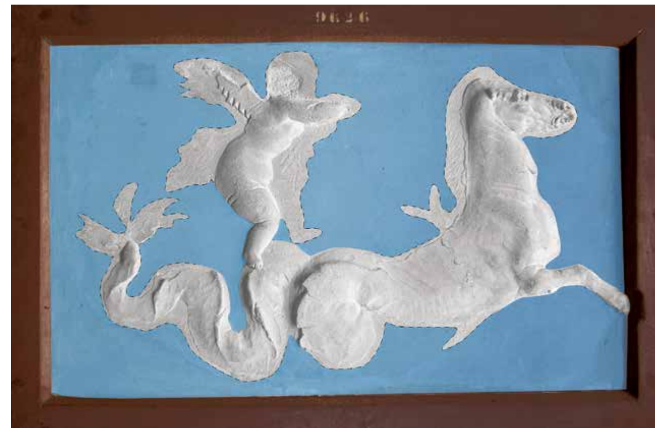
8. Naples, Museo Archeologico Nazionale. Proposition de restitution de la couleur originale du fond et mise en évidence avec un trait interrompu des contours originaux de la scène en stuc (MANN 9626) (DAO: D. Neyme)

Les stucs de Baïes et de Pouzzoles indiquent que cette zone était dotée d'ateliers spécialisés et particulièrement performants, au service d'une clientèle exigeante durant les deux premiers siècles de notre ère. R. Ling met en évidence un rapport étroit avec les productions de l' Urbs 40 , notamment avec les décors stuqués du tombeau des Valerii à Rome, ce qui n'est pas surprenant si l'on replace dans le contexte de l'époque impériale la ville de Baïes, où séjournaient les plus importantes familles romaines, les empereurs et leur cercle familial.