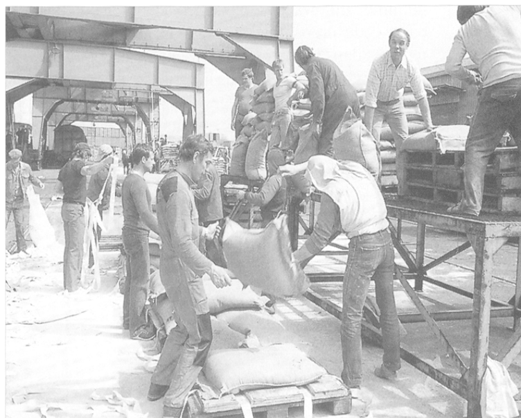
Rouen. Travail pénible sur le port.

gique sont ici particulièrement parlants. Cette analyse consiste, rappelons-le, à interpréter en termes individuels un ensemble de propositions portant sur des collectifs 6 . S'il existe, par exemple, une relation forte entre les variations de consommation et la proportion de femmes présentes dans l'espace, alors on peut raisonnablement conclure à l'existence d'un effet individuel pur, incarné par le genre et peu sensible au contexte. L'analyse, menée au niveau du quartier INSEE, ne révèle pas une telle constante. En un mot, l'effet du genre paraît médié par le milieu. En revanche, l'âge s'avère plus déterminant puisqu'on observe un lien certain entre la présence