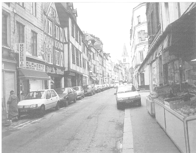
Centre-ville. « Réduire le stress à des causes purement organiques » ?

Régie par les conventions qui structurent la maladie et par celles qui phagocytent la définition légitime du « chagrin », la consommation est très peu sollicitée par l'événement du chômage, la précarisation massive, à moins qu'ils ne soient porteurs d'isolement, d'une rupture conjugale ou d'une somatisation excessive. Ce n'est en effet que passé le seuil des longues périodes chômées (2 ans et plus), qu'un lien paraît se dessiner entre la perte de l'emploi et le recours ; encore ne s'agit-il là que d'un épiphénomène. Ce constat va dans le sens des conclusions livrées par l'analyse des données de Sécurité Sociale, néanmoins, il grève tout également la crédibilité d'une partie de l'hypothèse du déclin, telle qu'elle avait été construite à partir de la relation qui semblait souder l'altération des conditions de vie à la détérioration de l'habitat . De fait, aucune relation n'a pu être établie entre la consommation, jugée en bloc ou à travers ses différents types, d'une part, la perte de l'emploi, l'incapacité à préserver son patrimoine (la vente de la propriété) ou à le maintenir (la vétusté du logement), le fait de devoir affronter une mobilité sociale descendante ou une homogamie peu conforme aux attentes du groupe d'origine, d'autre part. Les consommateurs les plus « assidus »