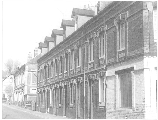
Le Houleme, faubourg ouvrier de Rouen.

Les feuilles de remboursement livrent deux éléments d'information : d'une part, les psychotropes prescrits ne paraissent pas désigner un état « dépressif » caractérisé, d'autre part, les ordonnances parvenant à la C.P.A.M. traduisent une médication peu spécifique et peu justiciable en l'occurrence d'une lecture réduite à la seule prise en compte des psychotropes. En effet, la grande majorité des demandes de remboursement concerne l'achat d'anxiolytiques et d'hypnotiques ; les antidépresseurs, les neuroleptiques et les sédatifs – censés parer à des situations de crise psychique, d'état de choc, ou de « désarroi » durable – n'occupant qu'une position marginale sur cet axe. Par ailleurs, la fréquence d'apparition de ces différents médicaments est inversement proportionnelle à la longueur et au caractère spécifique de l'ordonnance. Autrement dit, lorsque les antidépresseurs ou les neuroleptiques sont présents, ils représentent respectivement 57 et 54 % de la totalité de la prescription. Si on