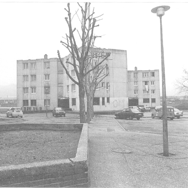
Quartier de la Houssière, en « bout de piste » de la ZUP.

Surtout, la prise en compte des différentes variables servant à décrire l'habitat permet de résumer et d'affiner ce qui vient d'être dit. Les quartiers où la consommation est la plus dense ne sont pas des ZUP, des espaces marqués par les grands ensembles ou les appartements individuels mais plutôt des zones caractérisées par un bâti pavillonnaire ouvrier, ancien et vétuste, et largement ouvert à l'accès à la propriété. Plusieurs éléments attestent du caractère vétuste et plus largement de la dépréciation dont semble pâtir ce type d'habitat. Le nombre de logements vacants y est supérieur à la moyenne, les indicateurs de vétusté concernant les sanitaires et le chauffage y enregistrent une valeur inégalée, enfin et c'est le corollaire de ce qui précède, la valeur locative de cet