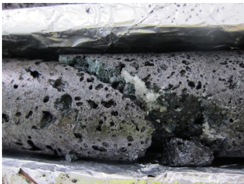
Figure 2 : Cristaux de calcite observés dans les pores d'une roche prélevée sur le site de CarbFix.